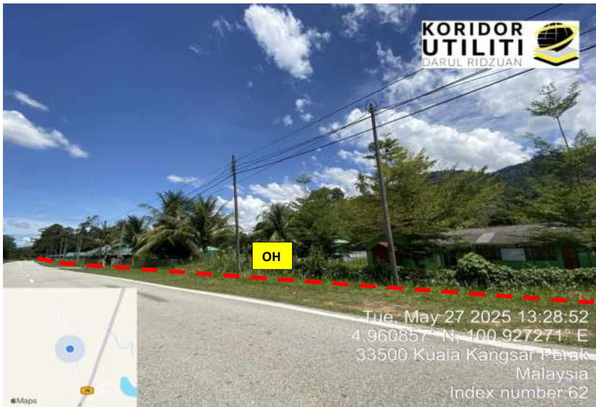
A303, JALAN KAMPUNG NGOR