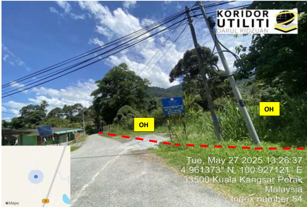
LORONG SEKOLAH AGAMA RAKYAT KG NGOR