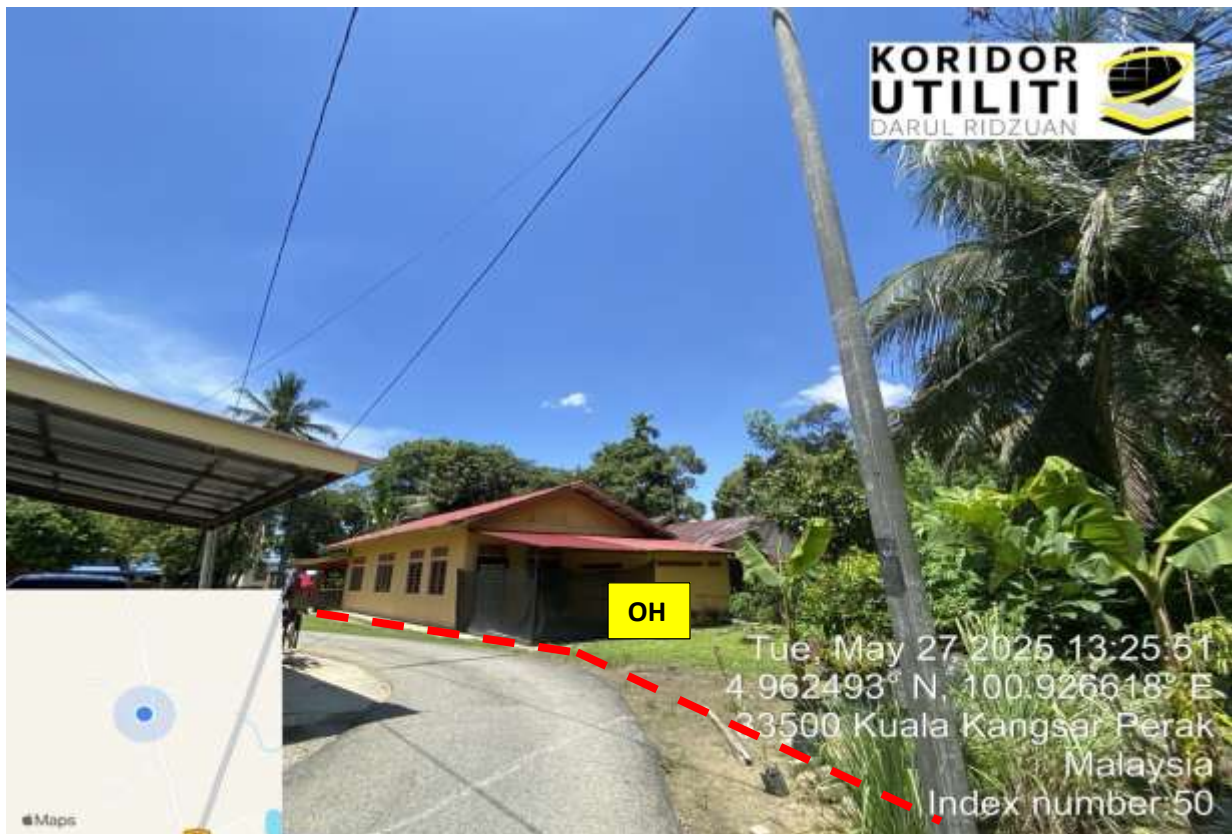
JALAN KG NGOR, MUKIM CHEGAR GALAH