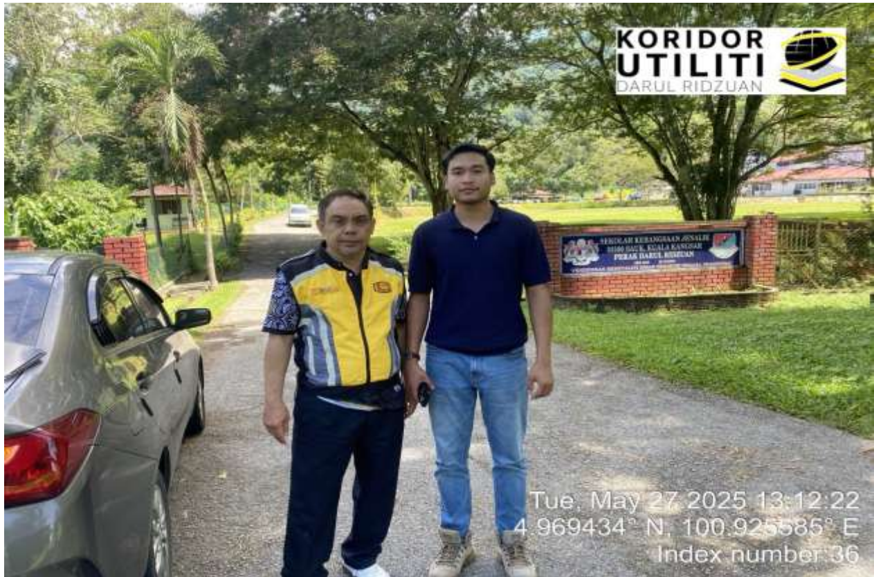
LOKASI DI HADAPAN SK JENALIK