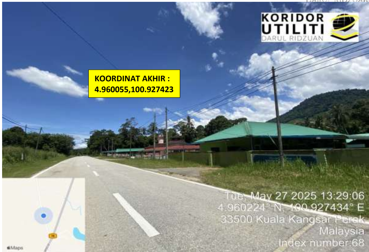
A303, JALAN KAMPUNG NGOR