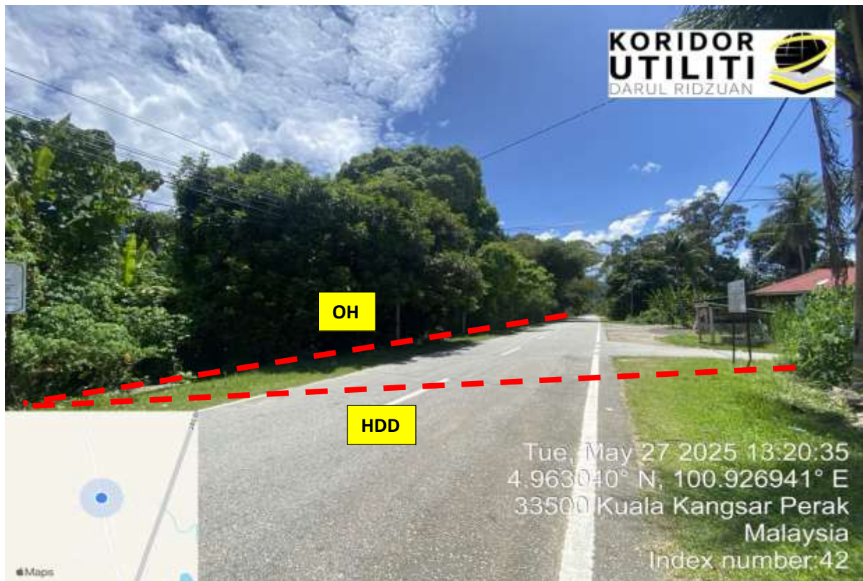
A303, JALAN KAMPUNG NGOR