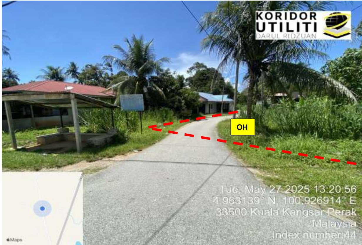
JALAN KG NGOR, MUKIM CHEGAR GALAH