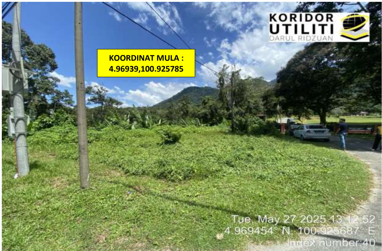
JALAN MASUK KE SK JENALIK