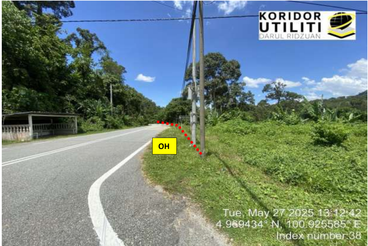
A303, JALAN KAMPUNG NGOR