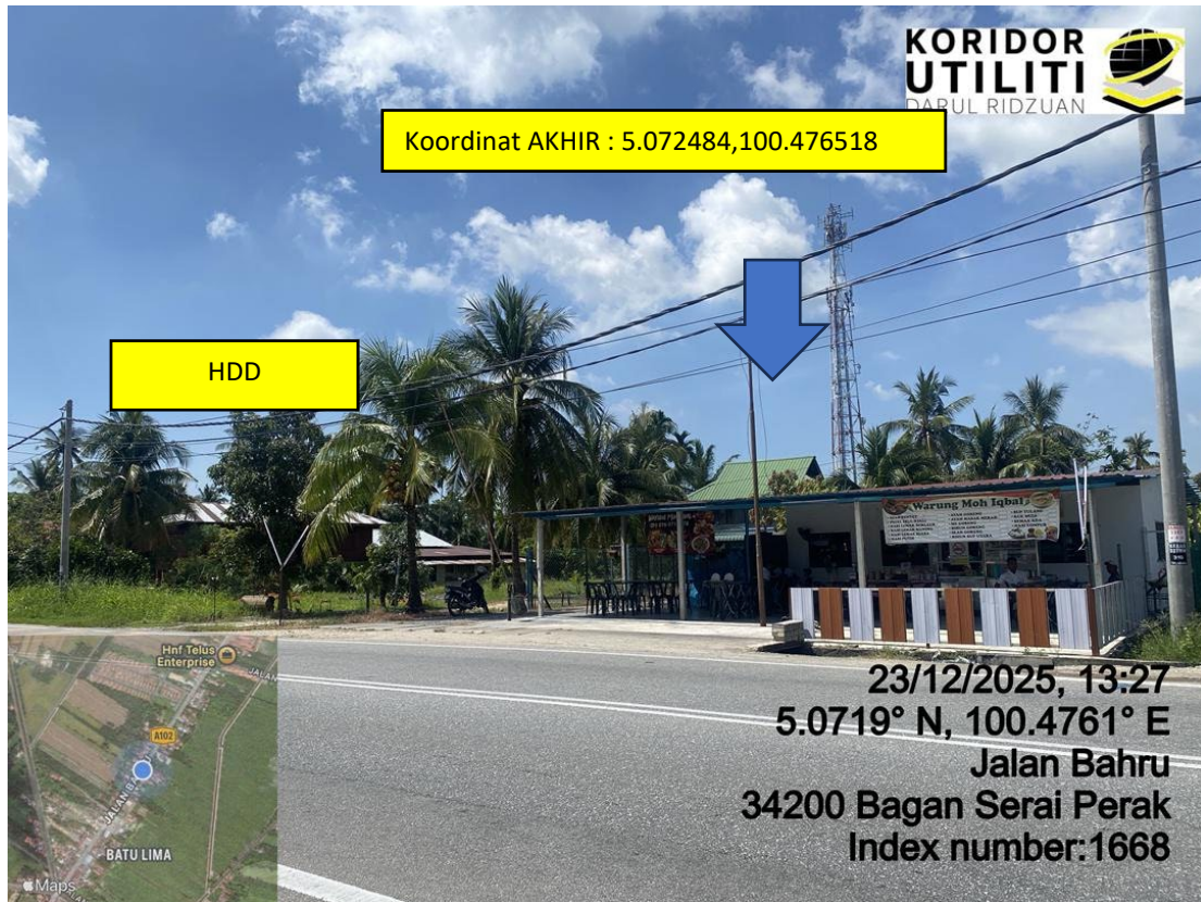
LOKASI DI JALAN BAHARU