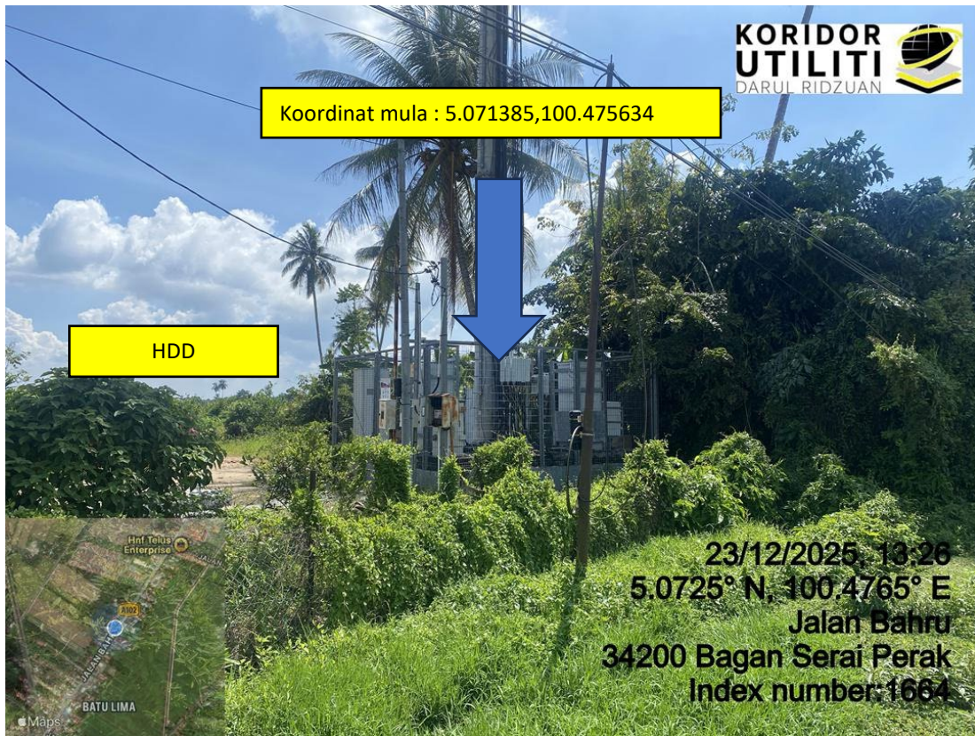
LOKASI DI JALAN BAHARU