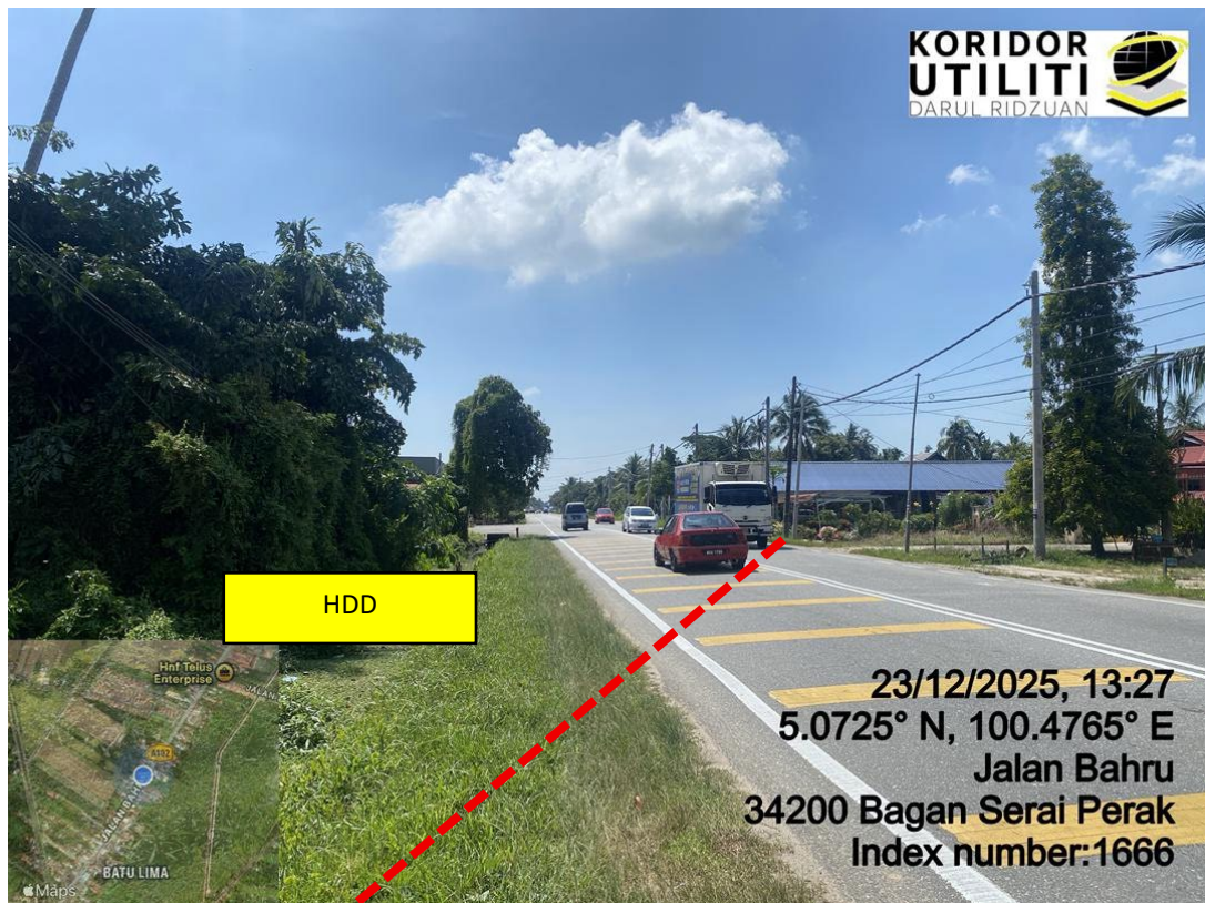
LOKASI DI JALAN BAHARU