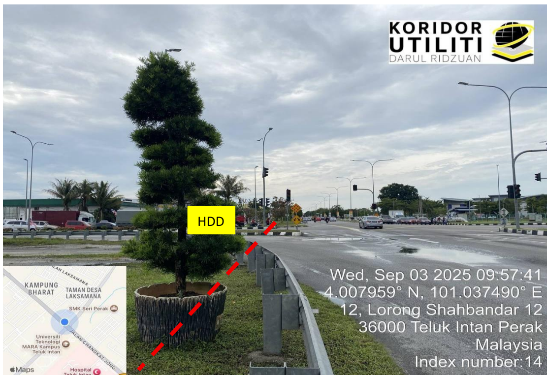
JALAN CHANGKAT JONG