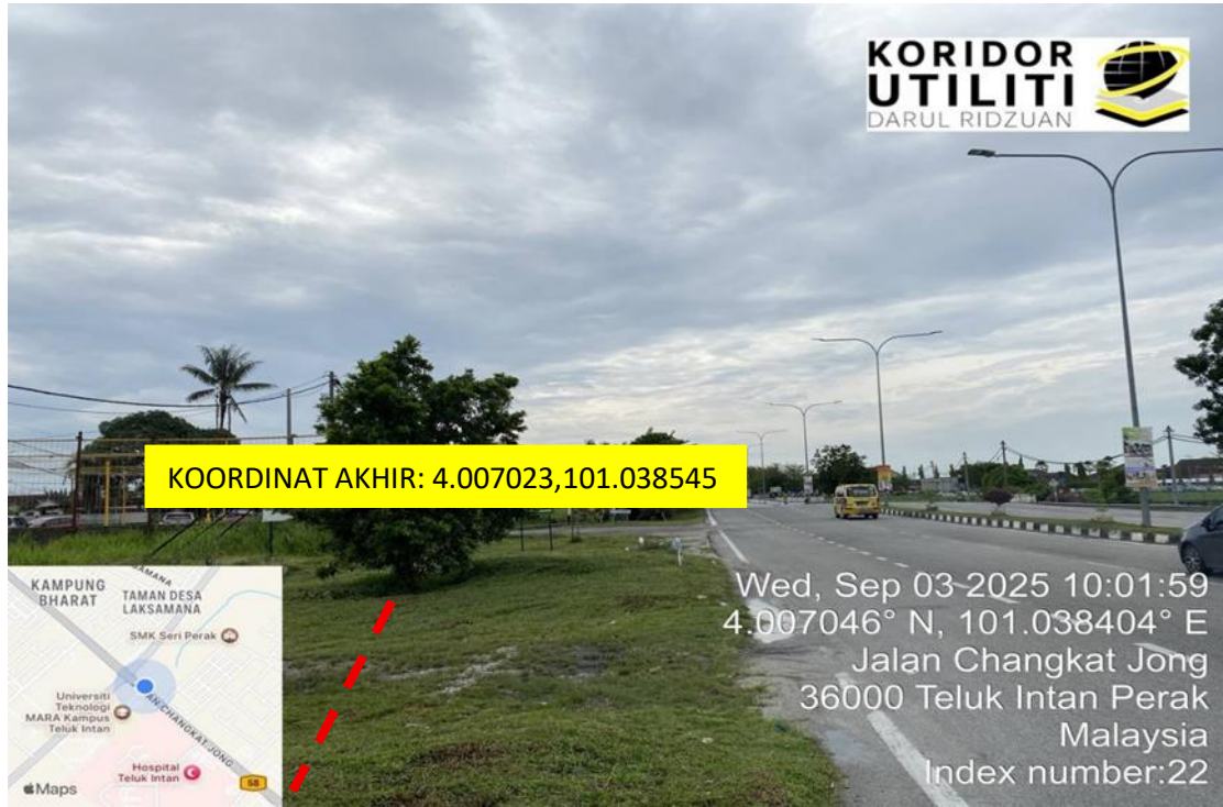
JALAN CHANGKAT JONG