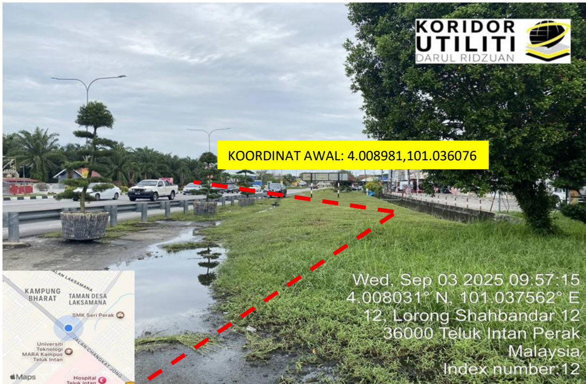
JALAN CHANGKAT JONG