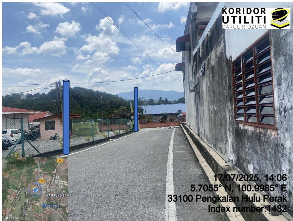
LOKASI DI JALAN TASEK