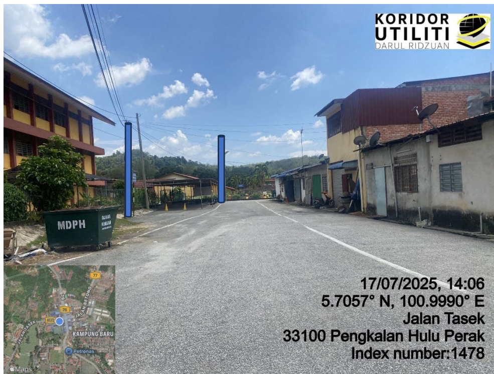
LOKASI DI JALAN TASEK