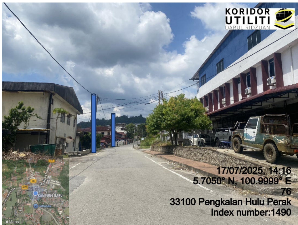
LOKASI DI JALAN KUALA KANGSAR – GRIK – PENGKALAN HULU

33100 Pengkalan Hulu Perak Index number:1488