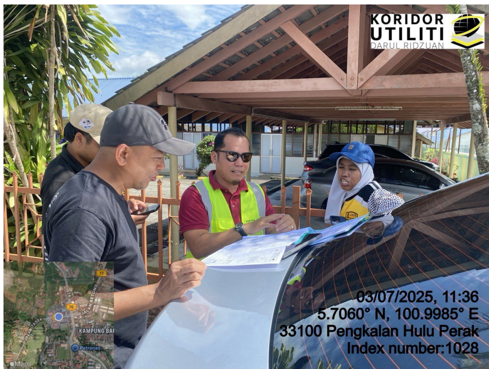
LOKASI DI JALAN SK KROH