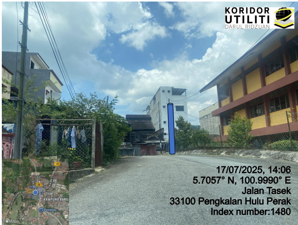
LOKASI DI JALAN TASEK