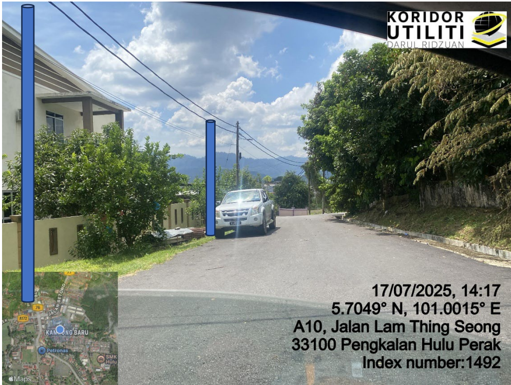
LOKASI DI JALAN LAM THING SEONG