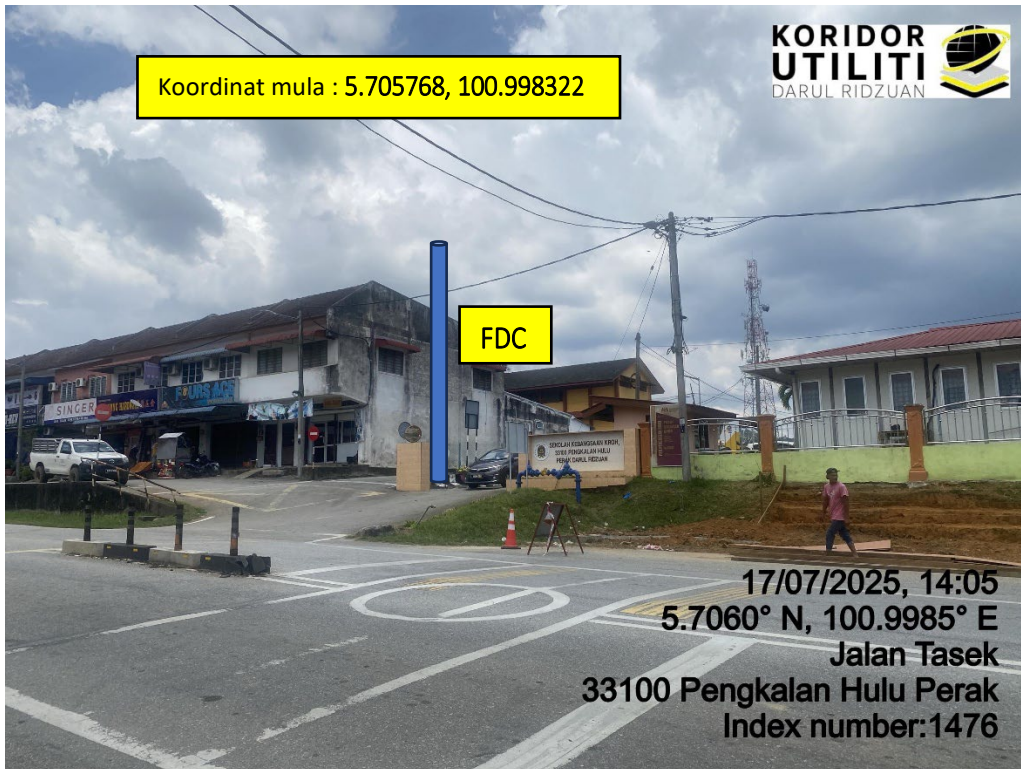
LOKASI DI JALAN SK KROH