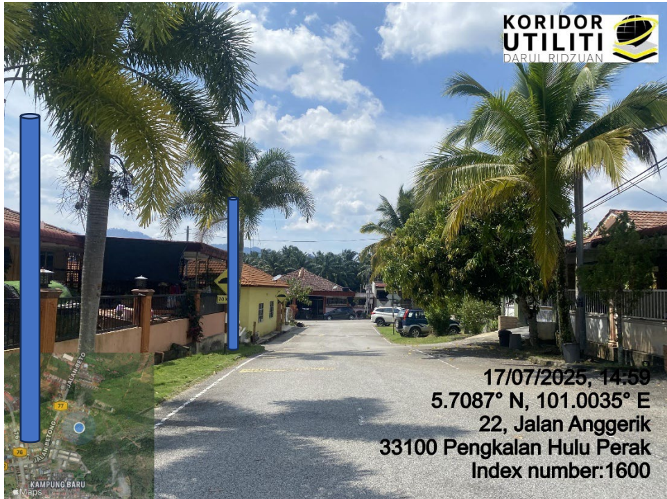
LOKASI DI JALAN ANGERIK