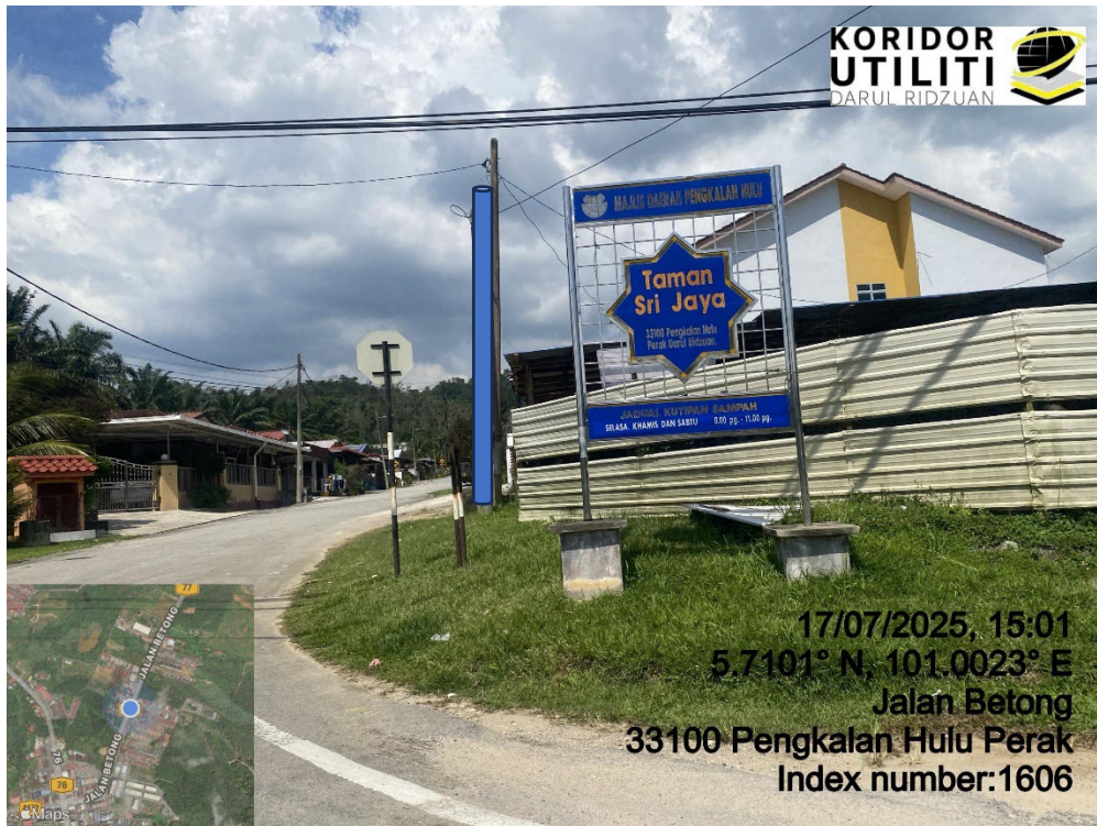
LOKASI DI JALAN TAMAN SRI JAYA