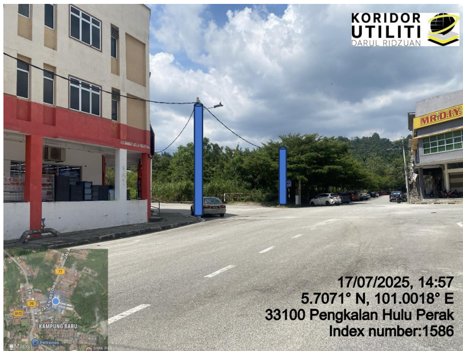
LOKASI DI JALAN PERSIARAN PH SENTRAL