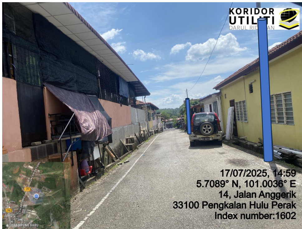
LOKASI DI JALAN ANGERIK