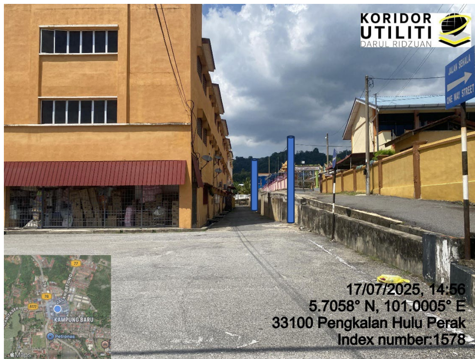
LOKASI DI JALAN TURFAIL