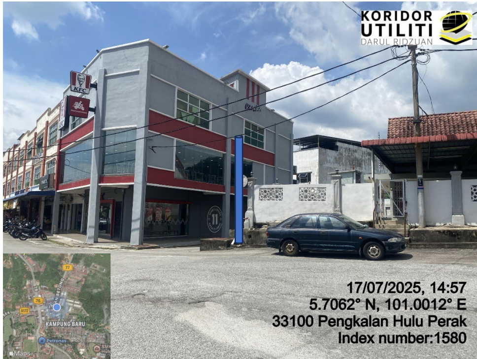
LOKASI DI JALAN PERSIARAN PH SENTRAL