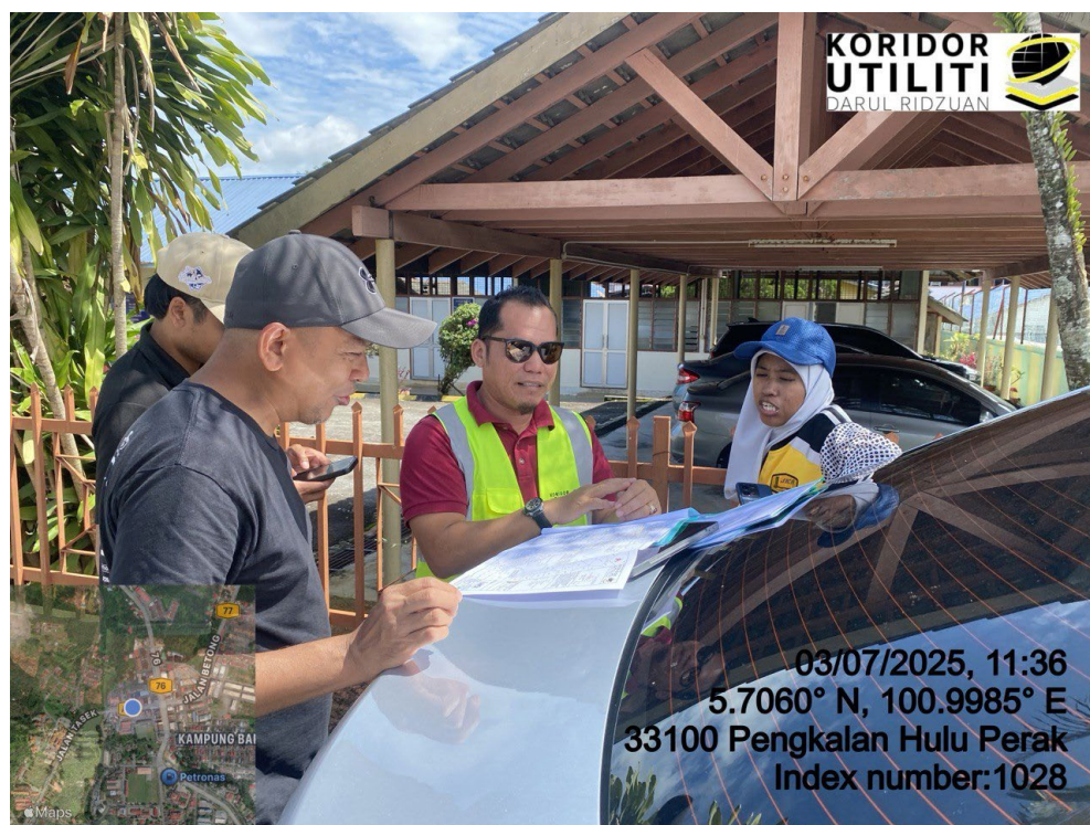
LOKASI DI JALAN SJKT PENGKALAN HULU