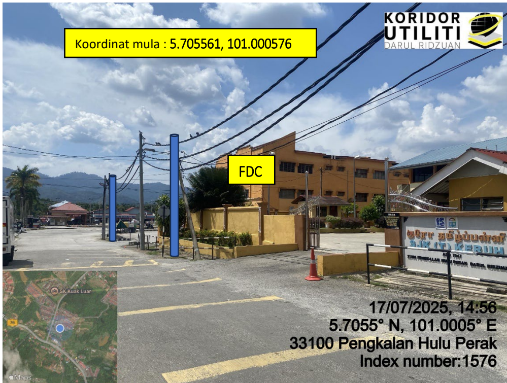
LOKASI DI JALAN SJKT PENGKALAN HULU