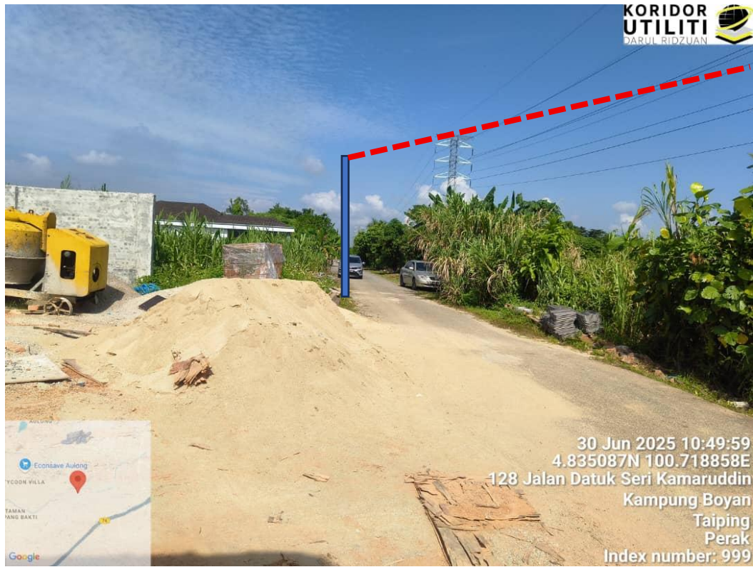
KOORDINAT MULA – CADANGAN PENANAMAN TIANG DI JALAN MPT