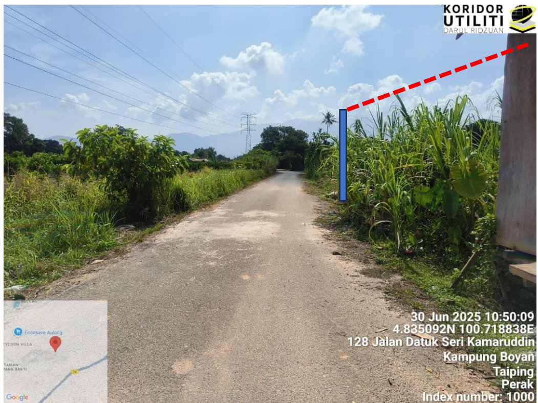
CADANGAN PENANAMAN TIANG TNB