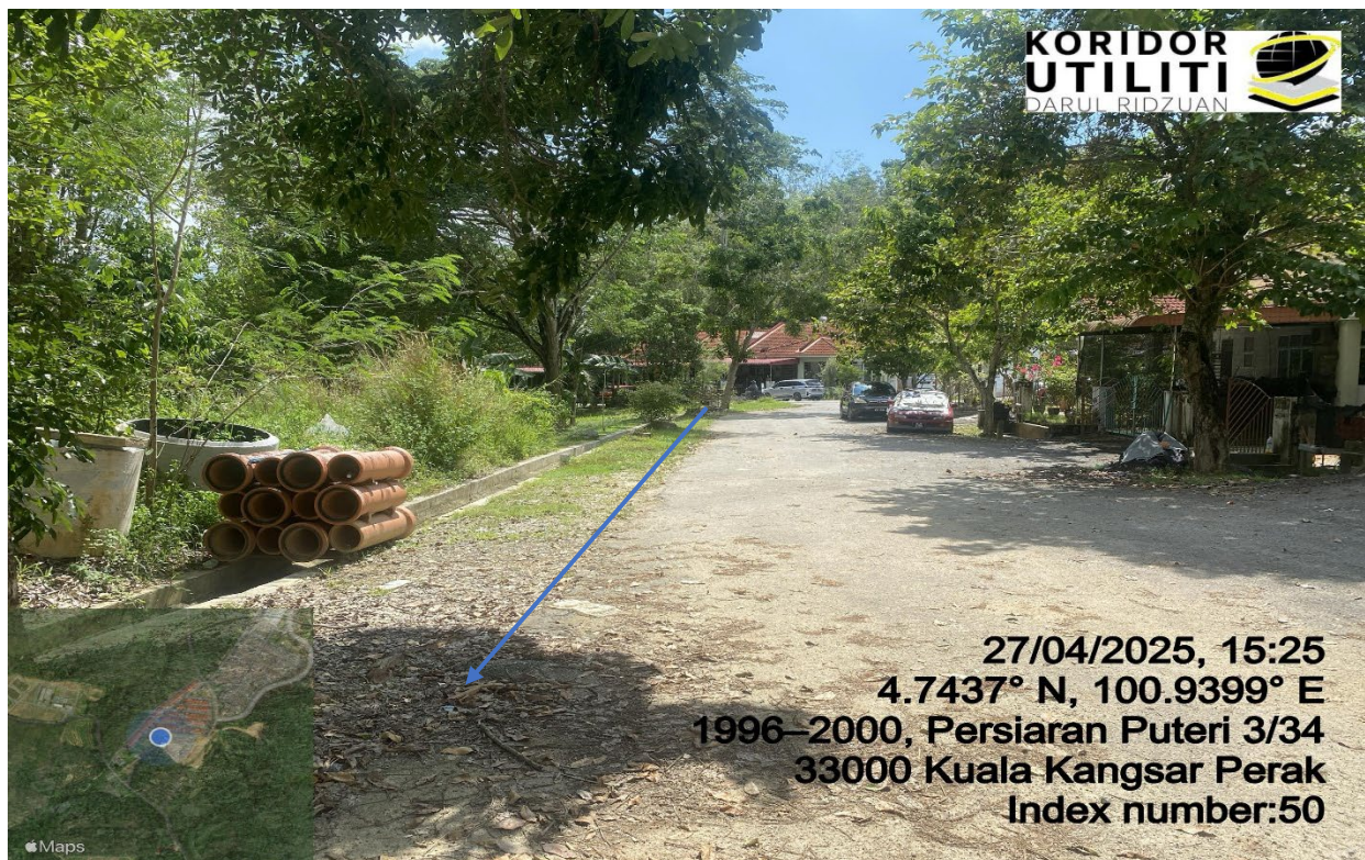
CADANGAN LALUAN OPEN CUT