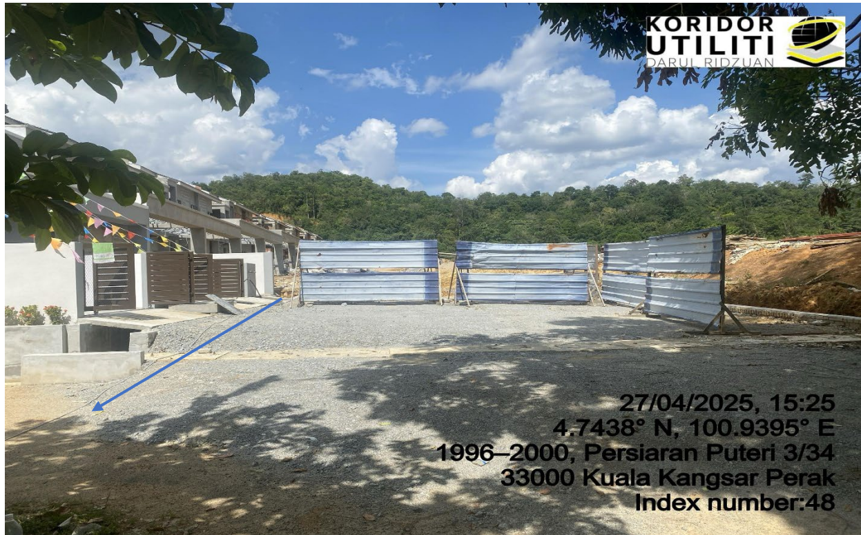
LALUAN CADANGAN OPEN CUT