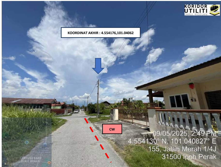
LOKASI KOORDINAT AKHIR KOREKAN TERBUKA DI JALAN MERAH ¼ J