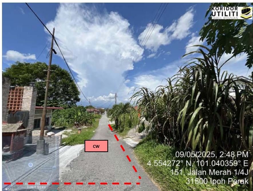
JAJARAN KOREKAN TERBUKA DI JALAN MERAH ¼J