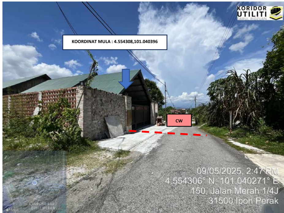
LOKASI KOORDINAT MULA KOREKAN TERBUKA DI JALAN MERAH ¼J