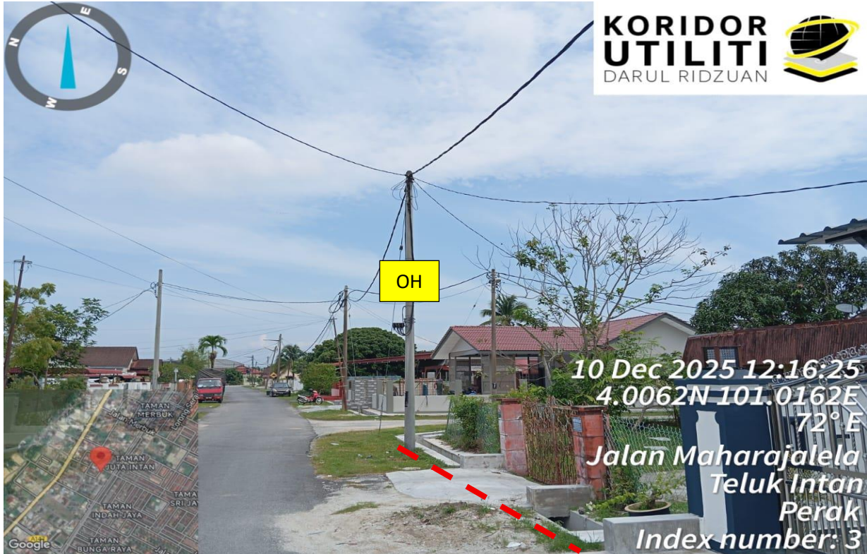
JALAN MAHARAJALELA, TAMAN ORKID