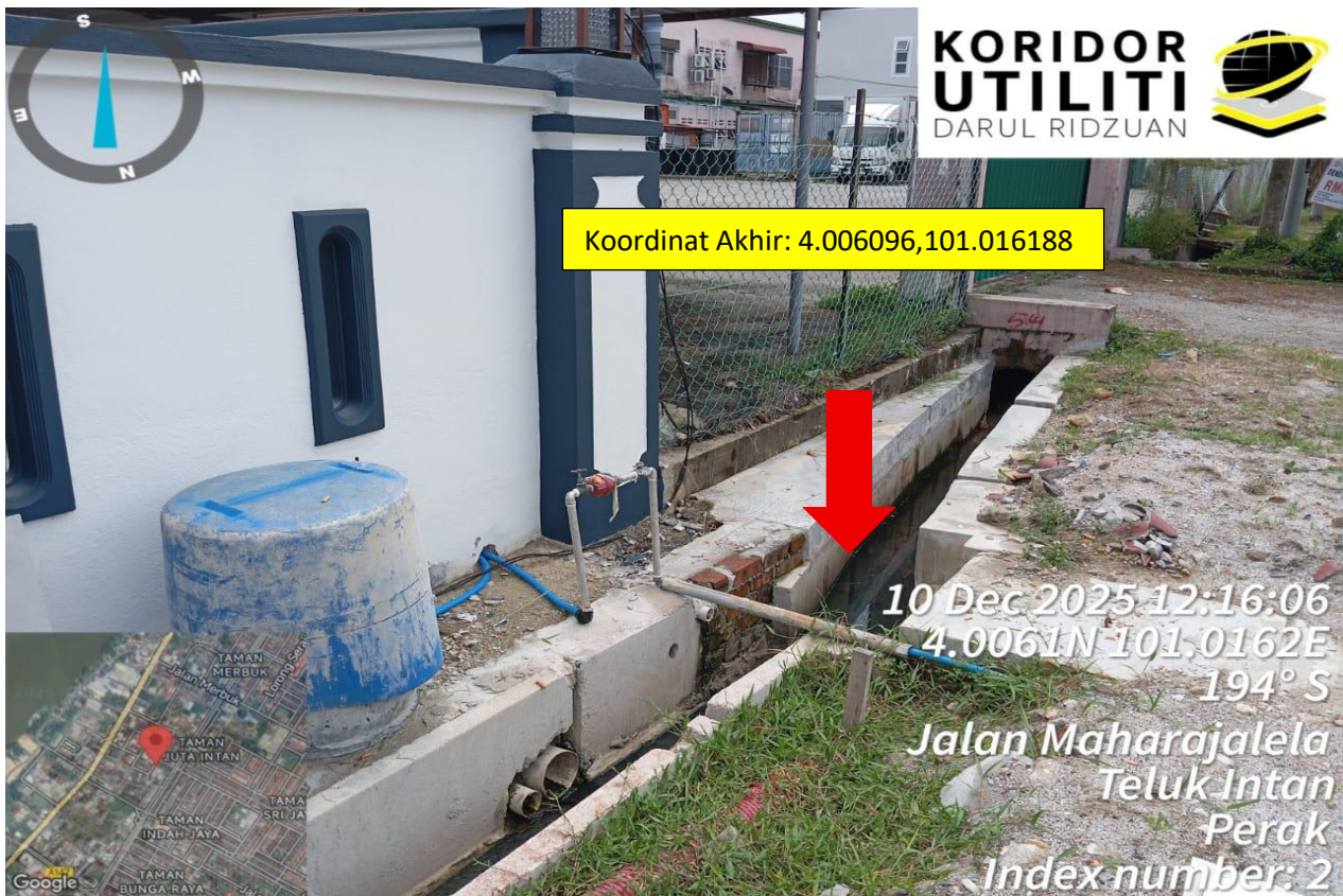
JALAN MAHARAJALELA, TAMAN ORKID