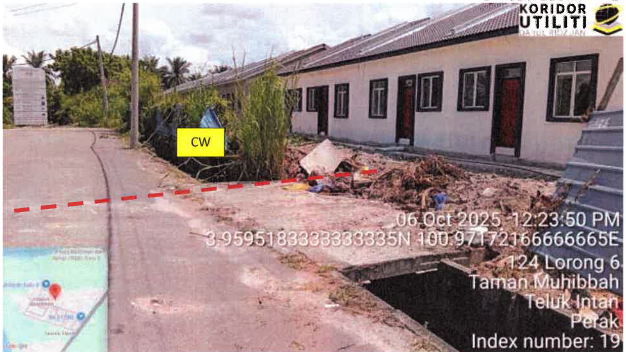
Lorong 6, Taman Muhibbah