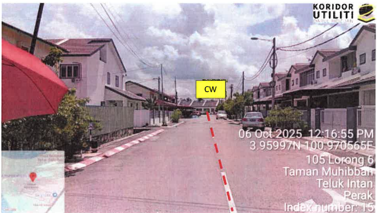
Lorong 6, Taman Muhibbah