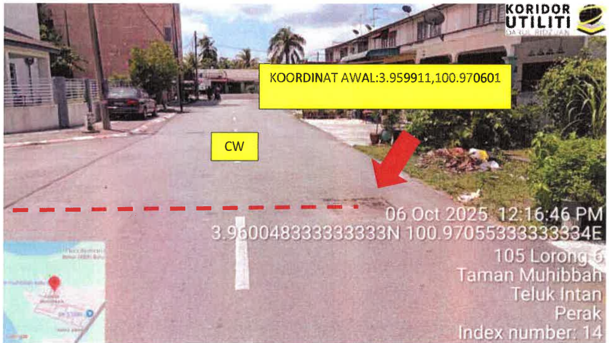
Lorong 6, Taman Muhibbah