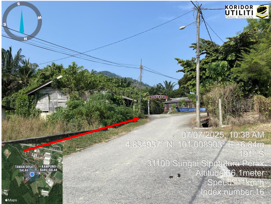
CADANGAN PENANAMAN TIANG DI JALAN PDT