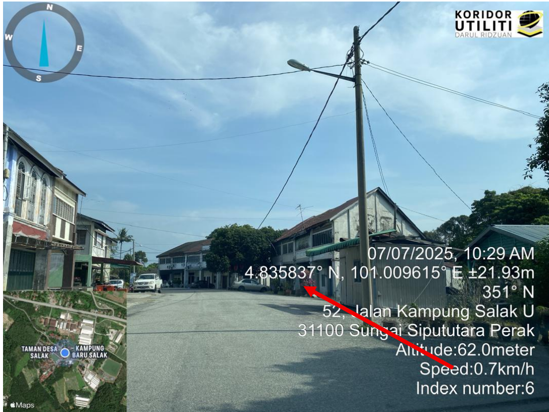
CADANGAN PENANAMAN TIANG MENGIKUT JAJARAN TIANG TNB