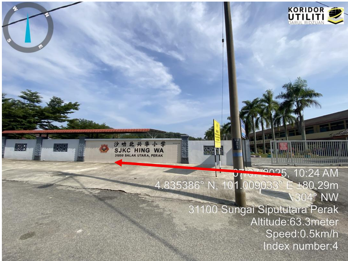
KOORDINAT MULA – CADANGAN PENANAMAN TIANG DI HADAPAN SEKOLAH