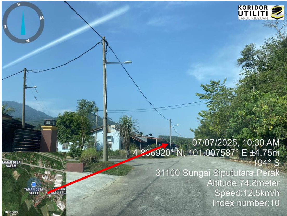
CADANGAN PENANAMAN TIANG MENGIKUT JAJARAN TIANG TNB (JALAN MAJLIS)