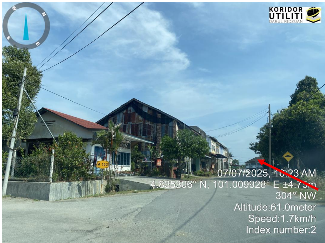
CADANGAN PENANAMAN TIANG DI JALAN JKR - JALAN SALAK UTARA LAMA (A153)