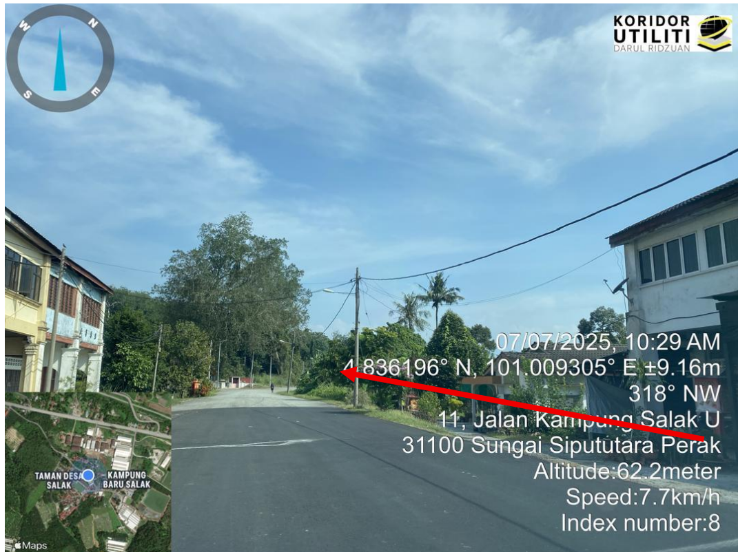
CADANGAN PENANAMAN TIANG MENGIKUT JAJARAN TIANG TNB