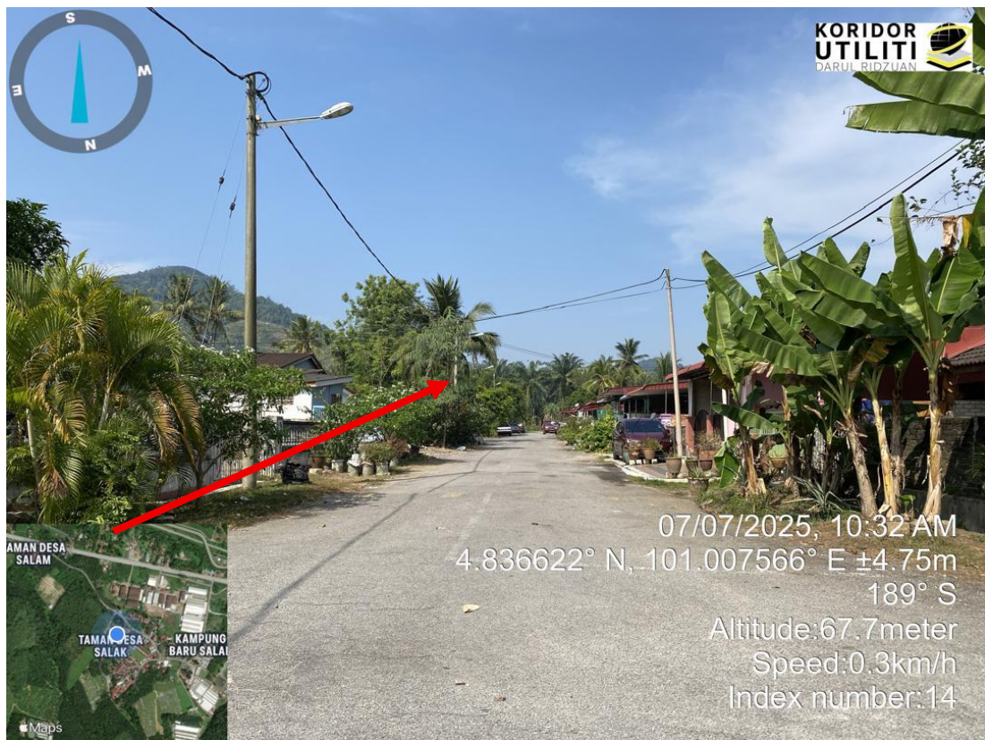
CADANGAN PENANAMAN TIANG MENGIKUT JAJARAN TIANG TNB (JALAN MAJLIS)