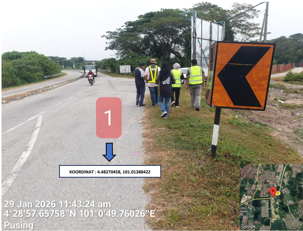
LOKASI ANGGARAN MISSING MANHOLE 1 DI LEBUHRAYA IPOH – LUMUT (FT.05)