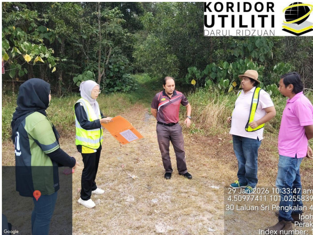
LAWATAN TAPAK AWALAN BERSAMA WAKIL JKR KINTA DAN WAKIL TTDC