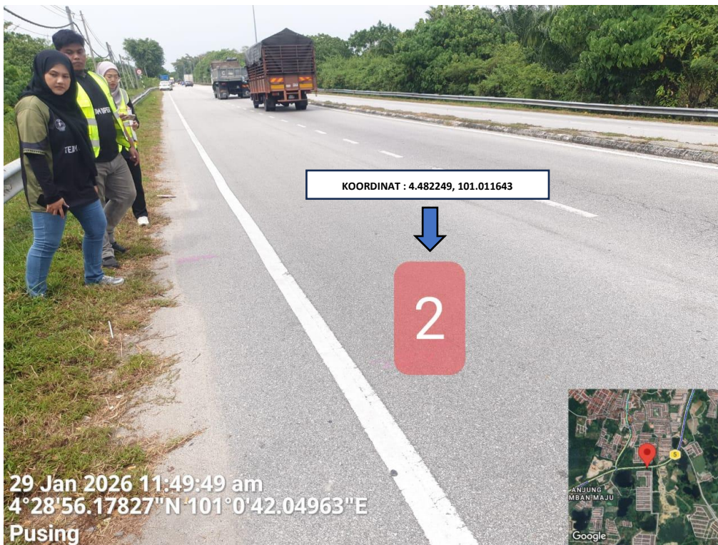
LOKASI ANGGARAN MISSING MANHOLE 2 DI LEBUHRAYA IPOH – LUMUT (FT.05)