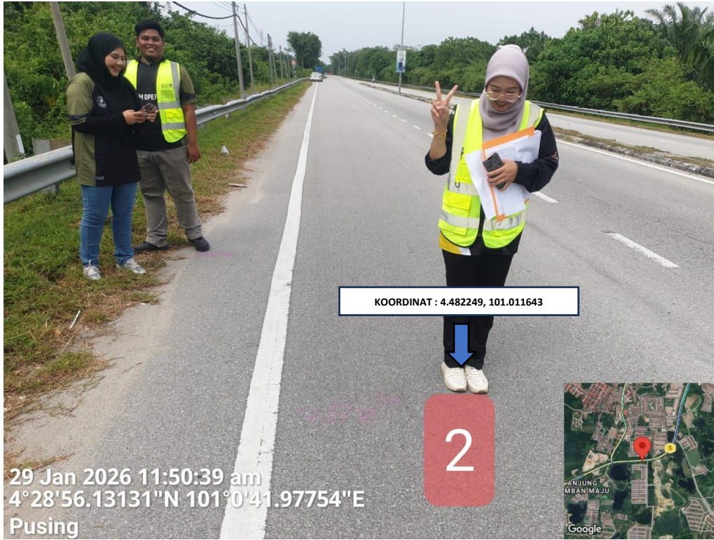
LOKASI ANGGARAN MISSING MANHOLE 2 DI LEBUHRAYA IPOH – LUMUT (FT.05)