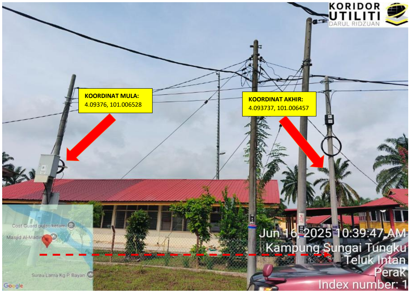
JALAN AIR MATI – PASIR JENDERIS