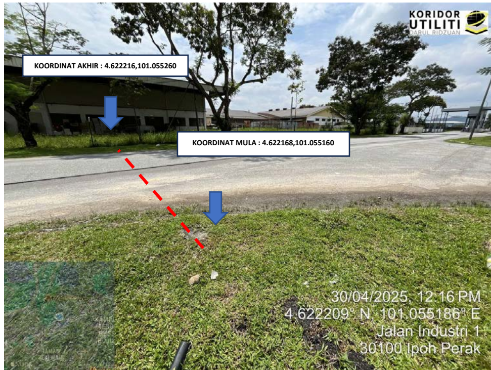
LOKASI KOORDINAT MULA DAN AKHIR KOREKAN TERBUKA DI JALAN INDUSTRI 1