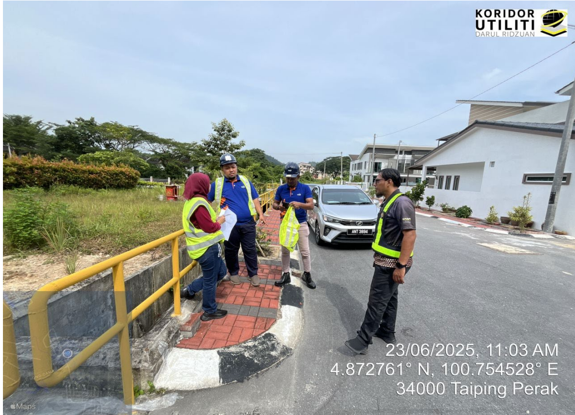
PERBINCANGAN BERSAMA PIHAK PBM DAN PEMOHON