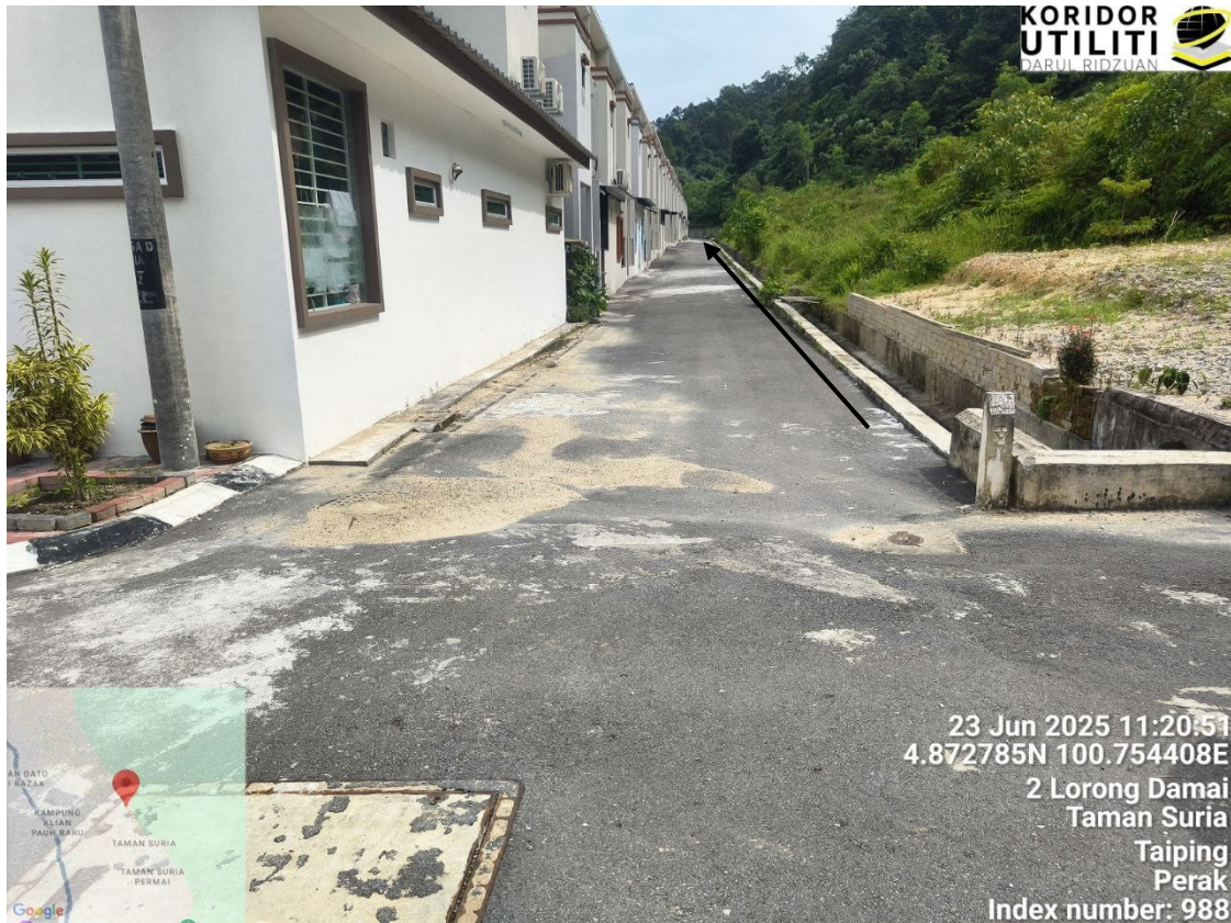
CADANGAN LALUAN PENANAMAN TIANG