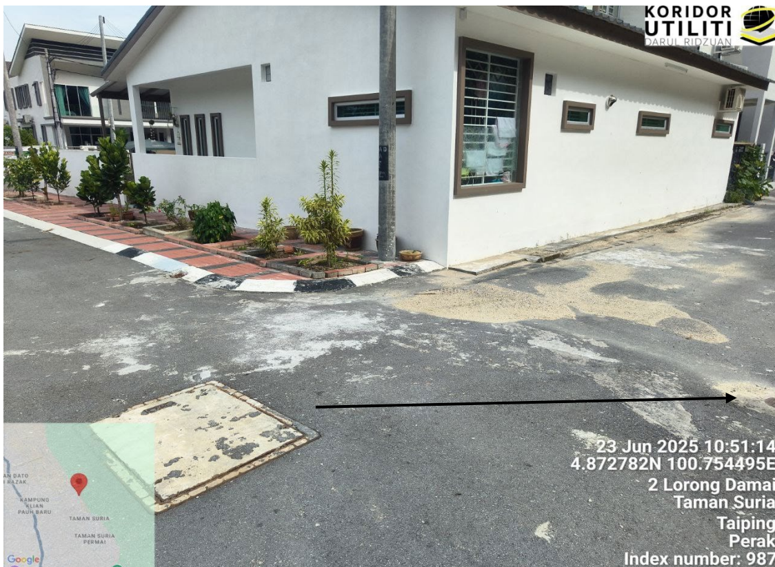
LALUAN CADANGAN MICROTRENCHING