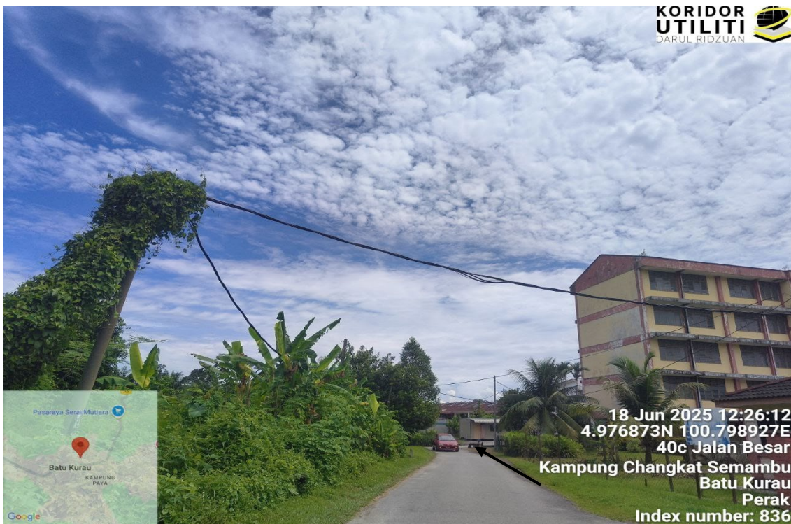
CADANGAN LALUAN PENANAMAN TIANG MENGIKUT TIANG TNB