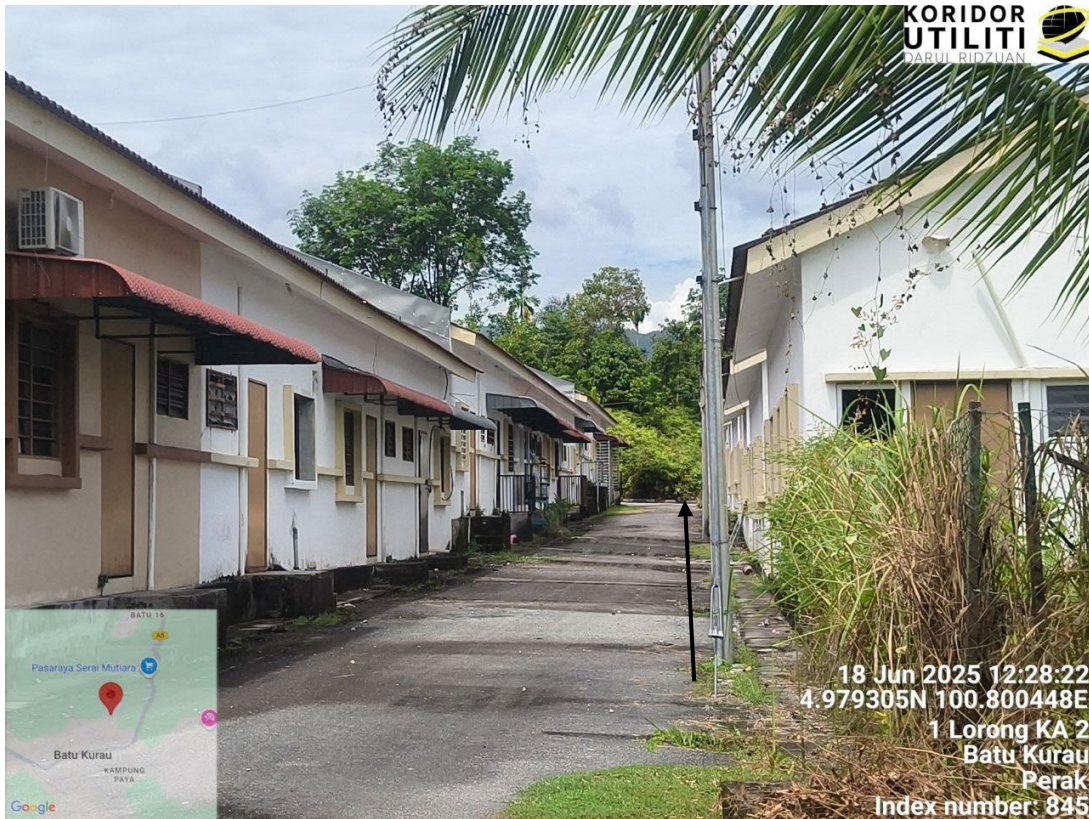
CADANGAN LALUAN PENANAMAN TIANG MENGIKUT TIANG TNB