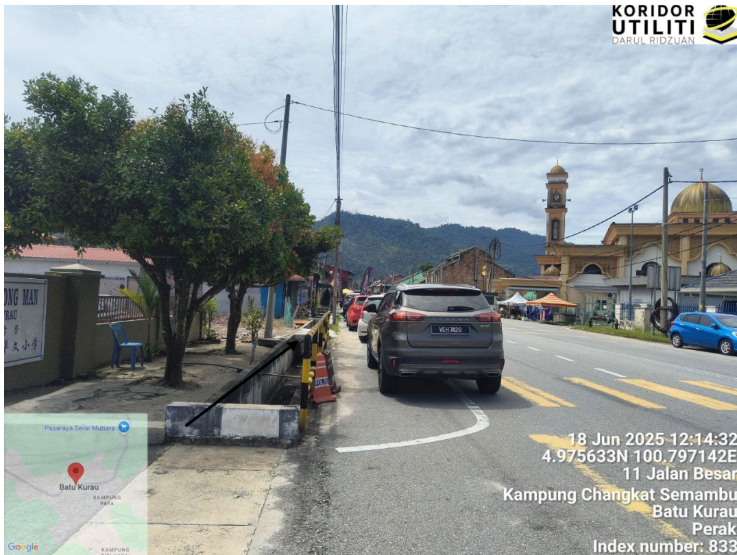
CADANGAN PENANAMAN TIANG DI JALAN JKR – KOORDINAT MULA HADAPAN SEKOLAH