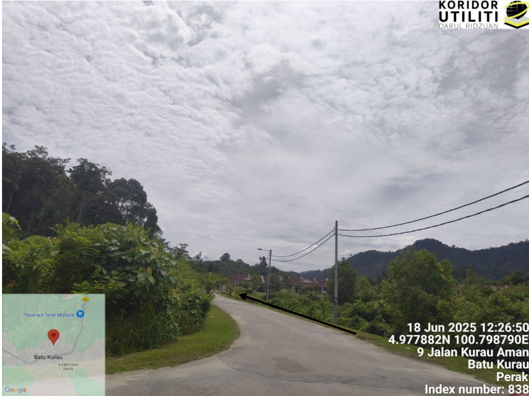
CADANGAN LALUAN PENANAMAN TIANG MENGIKUT TIANG TNB