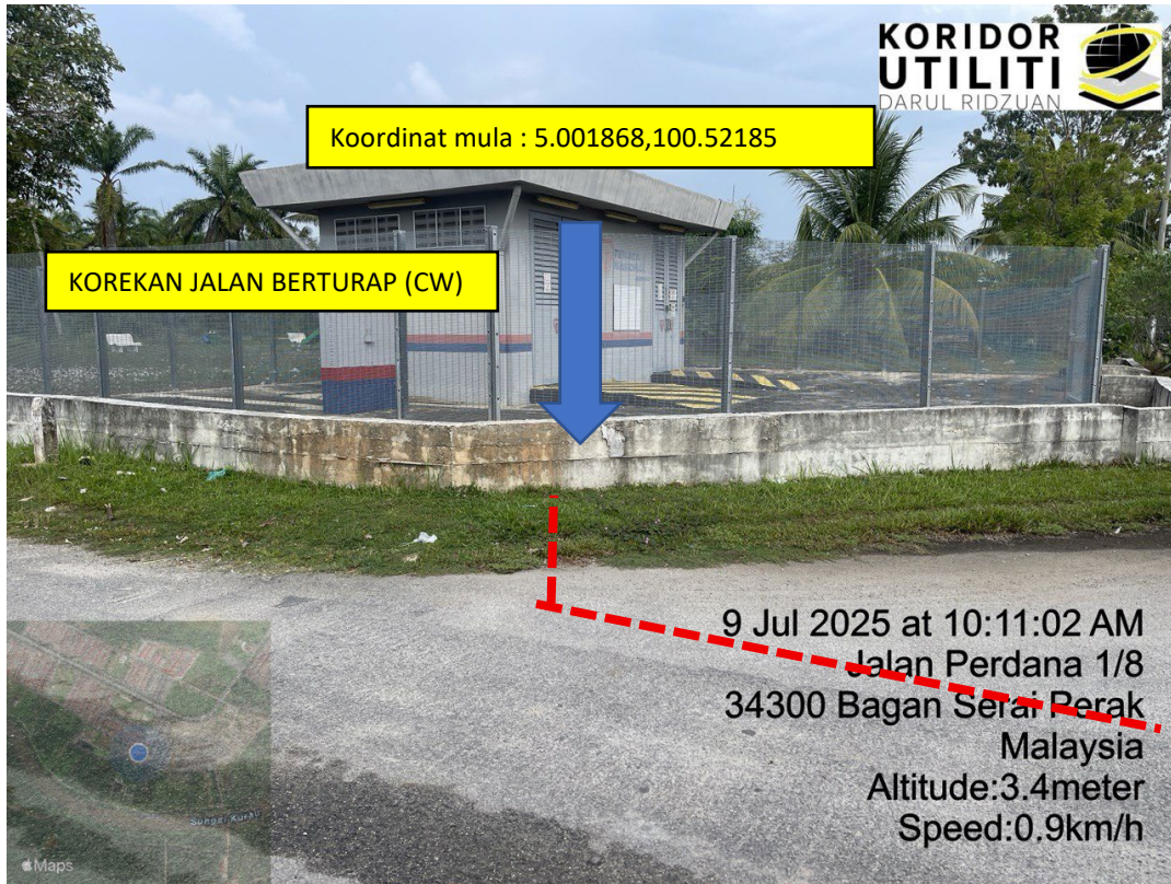
LOKASI DI JALAN PERDANA