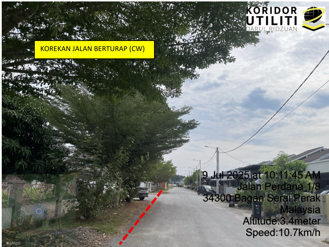
LOKASI DI JALAN PERDANA 1/8