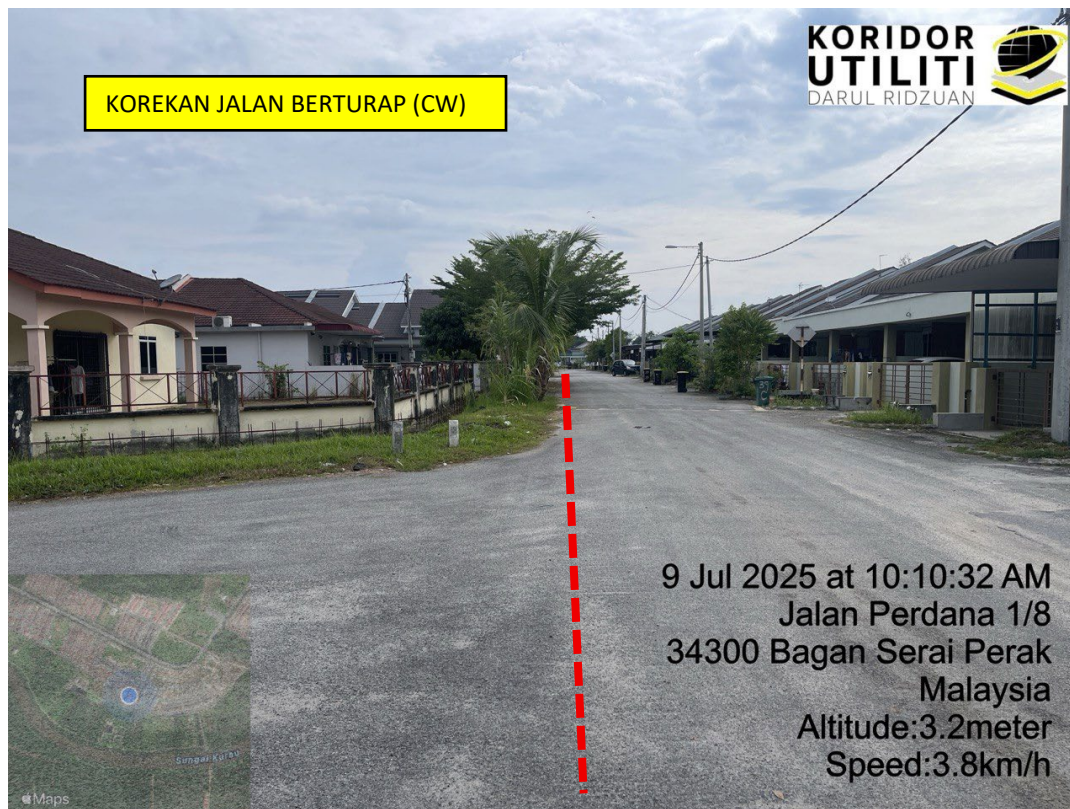
LOKASI DI JALAN PERDANA 1/8