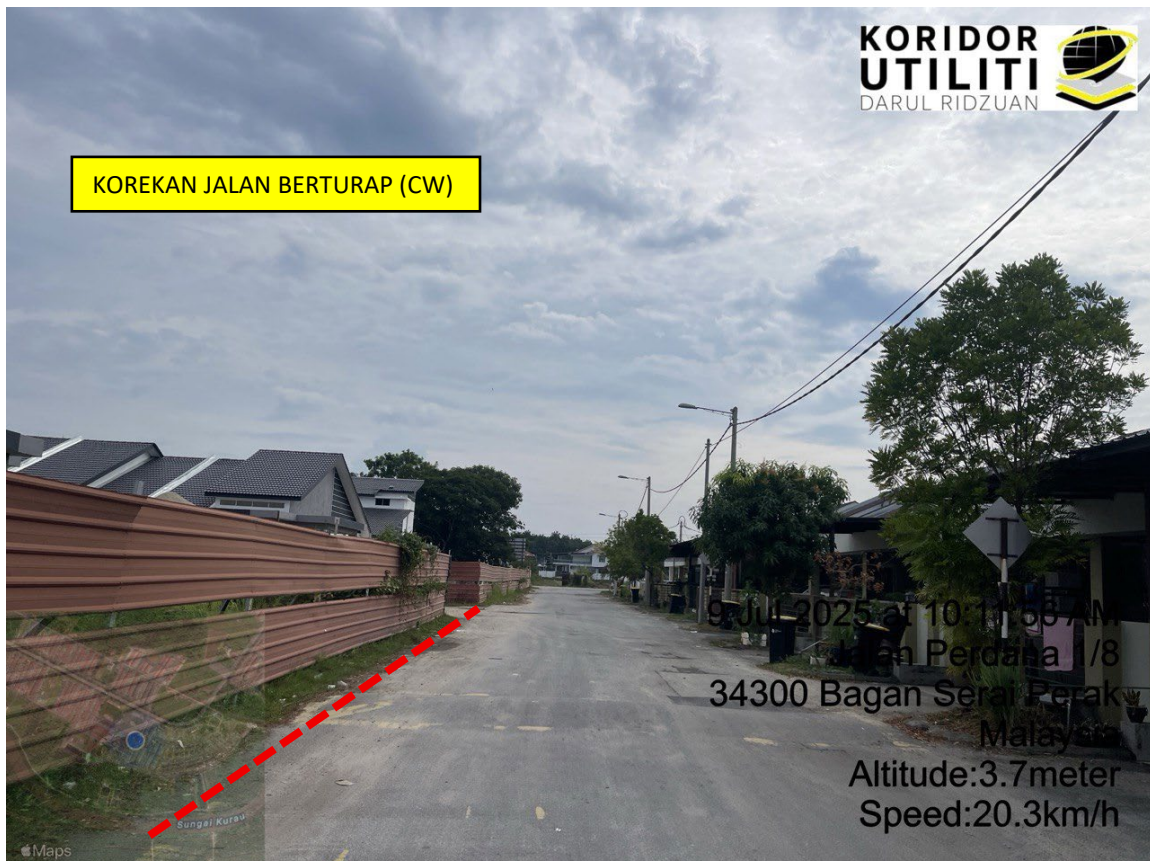
LOKASI DI JALAN PERDANA 1/8