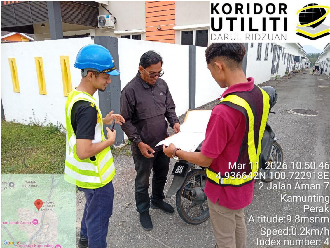
LAWATAN TAPAK AWALAN PIHAK KUDR BERSAMA PBM DAN PEMOHON