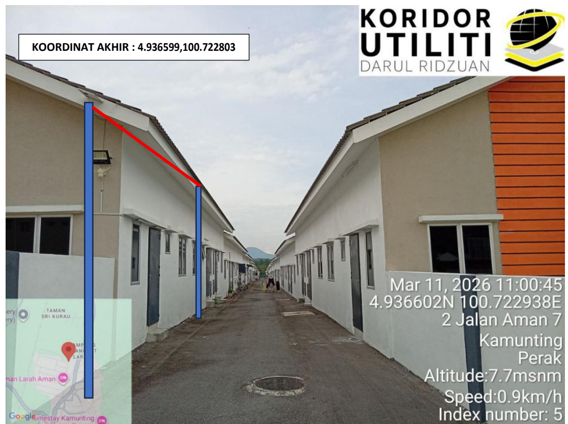
KOORDINAT AKHIR - JAJARAN PENANAMAN TIANG