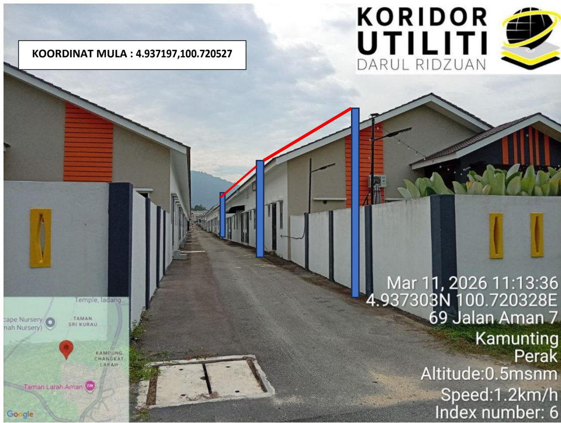
KOORDINAT MULA - CADANGAN PENANAMAN TIANG