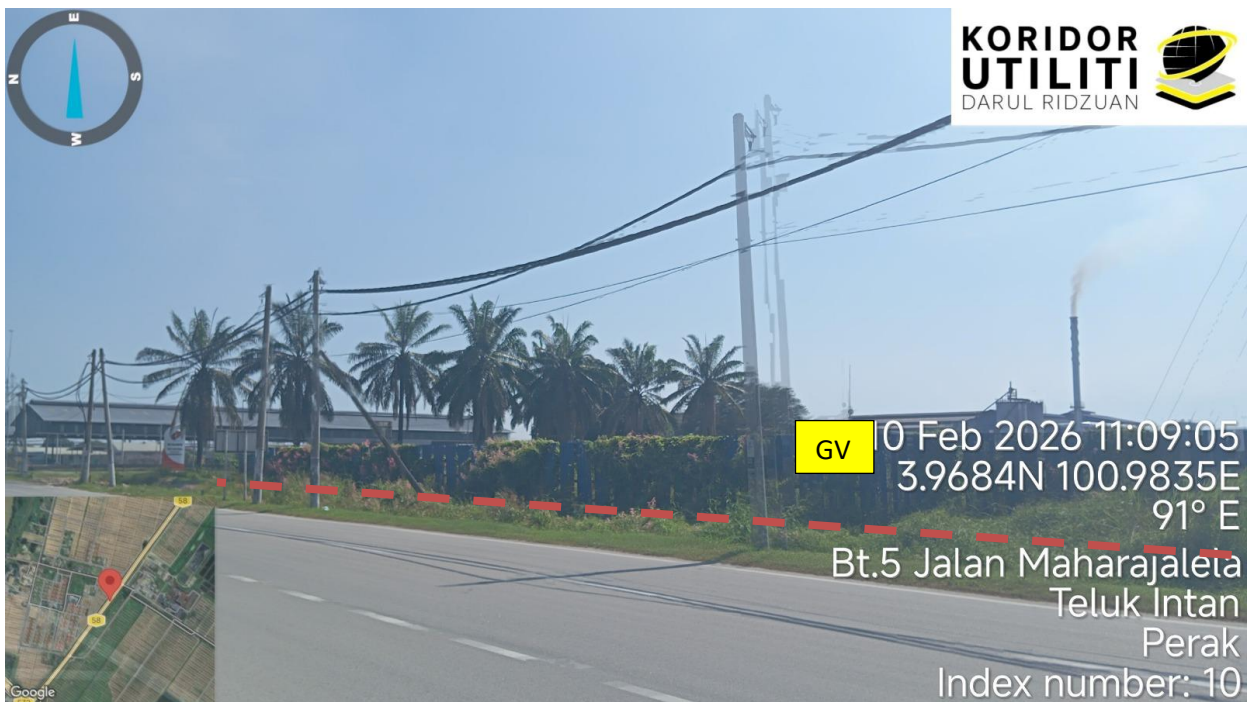
Jalan Maharajalela (58)