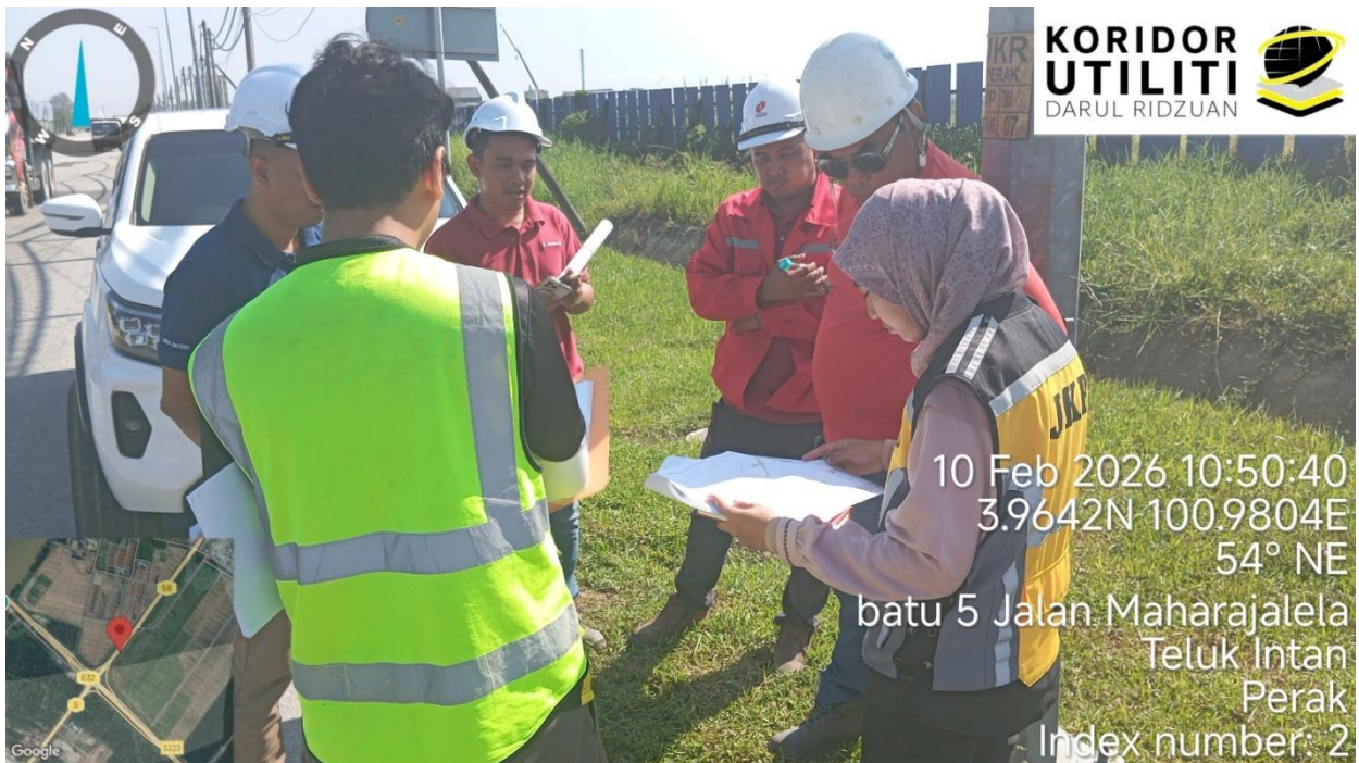
Jalan Maharajalela (58)