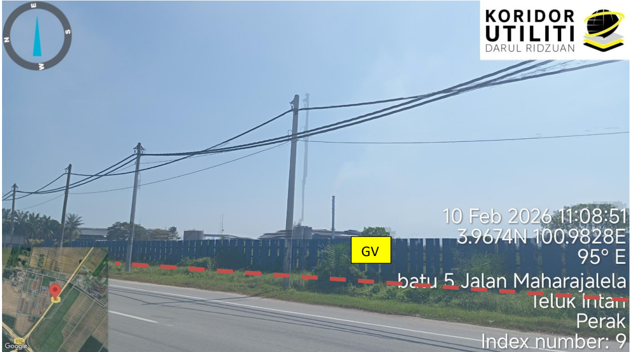
Jalan Maharajalela (58)