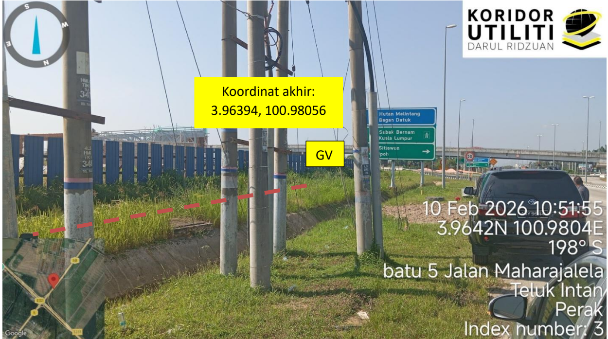
Jalan Maharajalela (58)