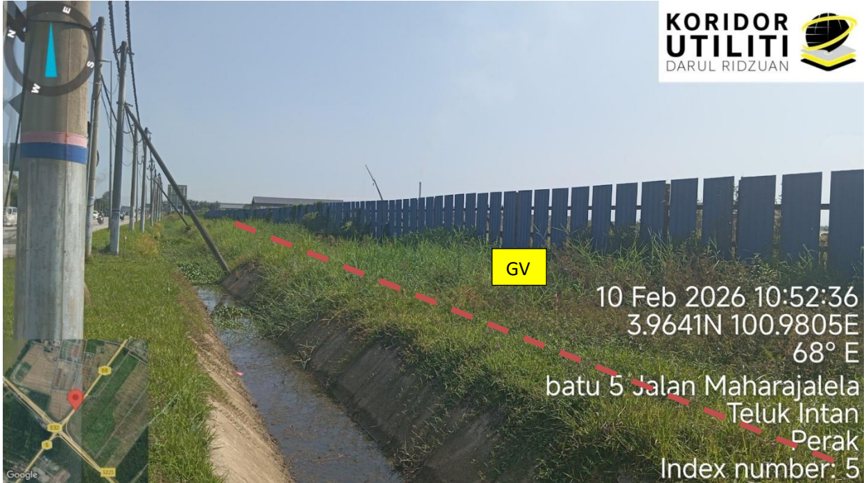
Jalan Maharajalela (58)