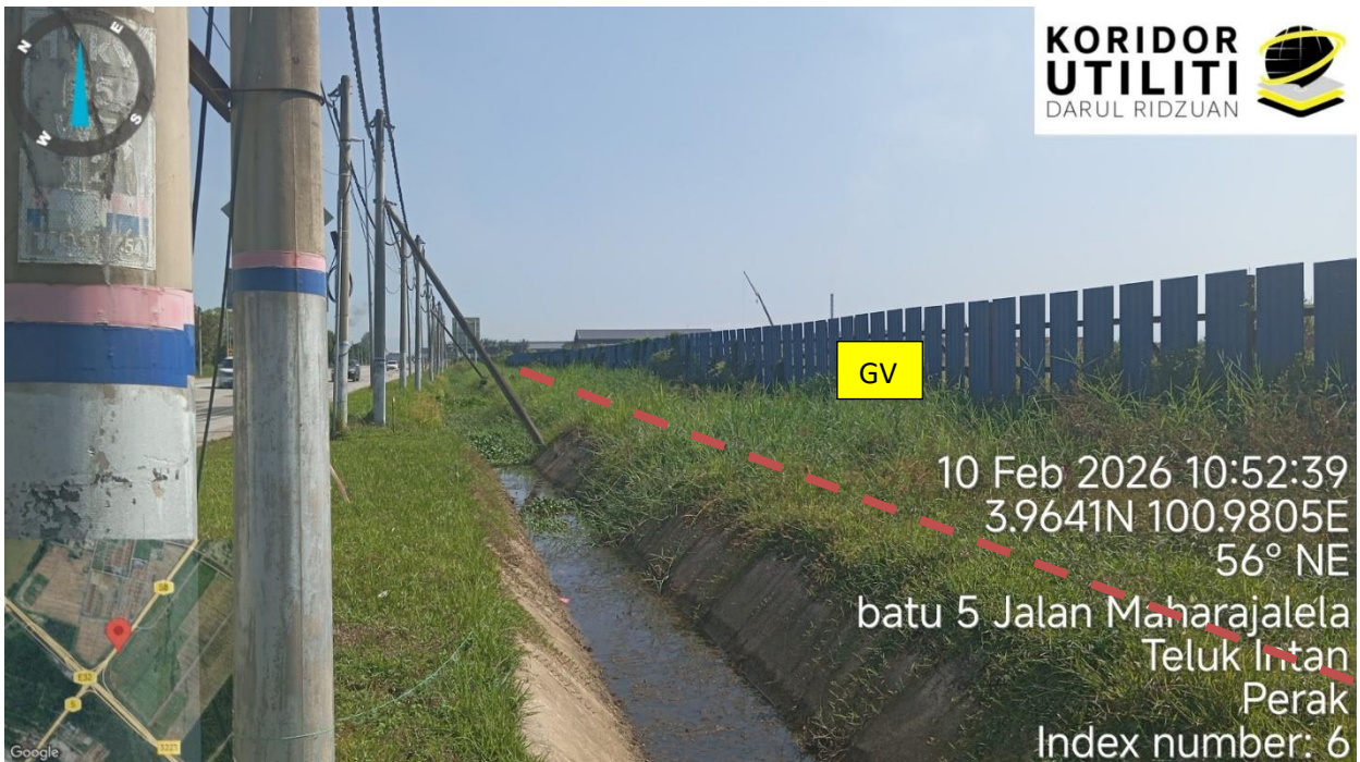
Jalan Maharajalela (58)