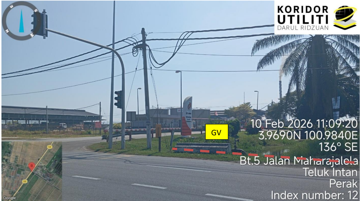
Jalan Maharajalela (58)