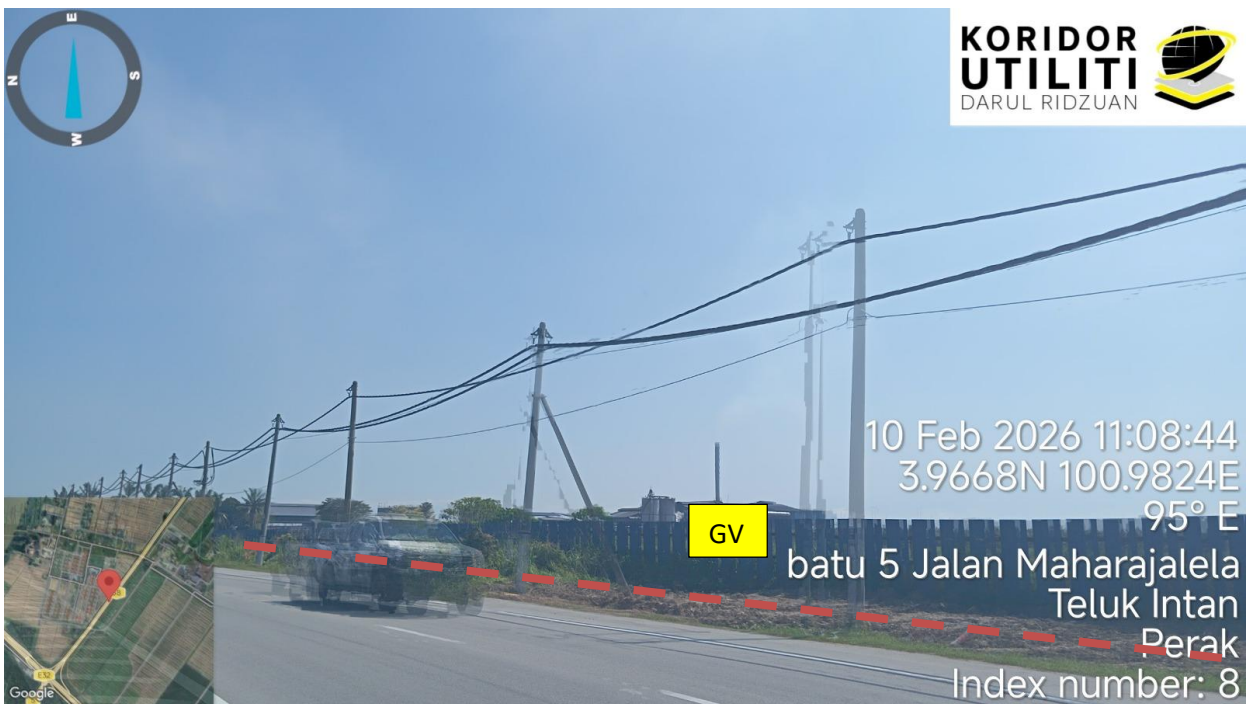
Jalan Maharajalela (58)