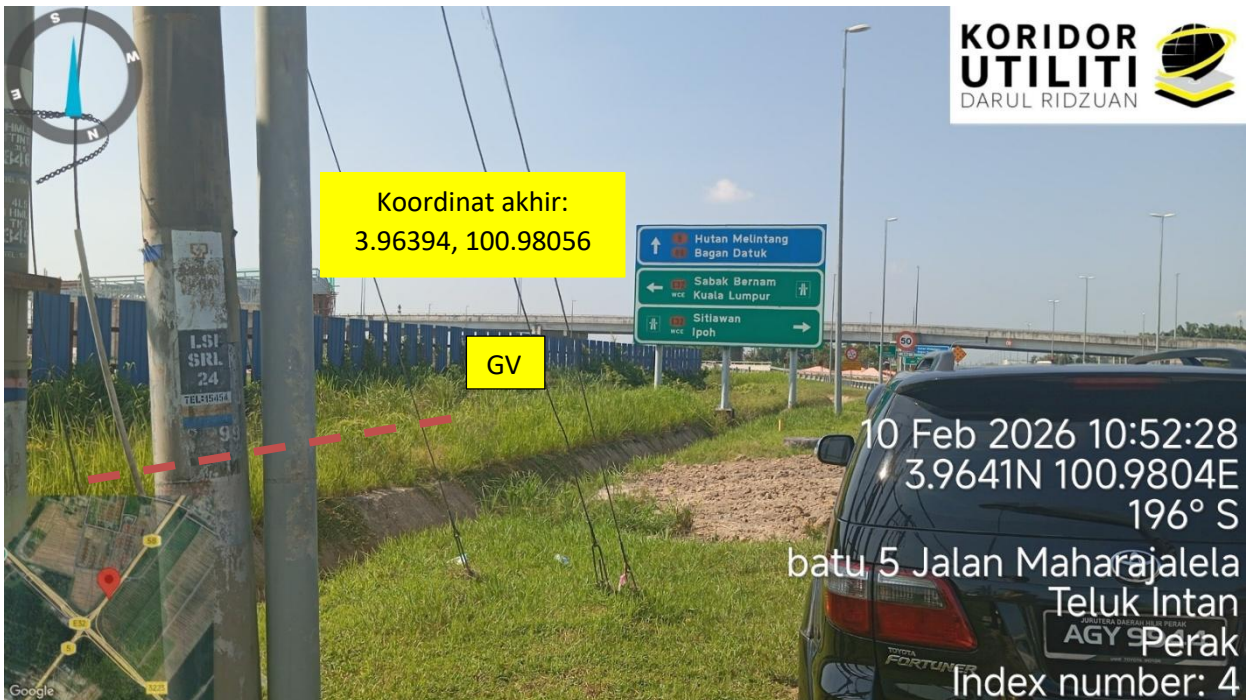
Jalan Maharajalela (58)