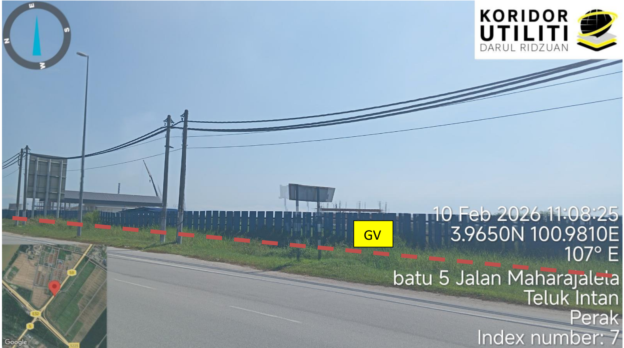
Jalan Maharajalela (58)