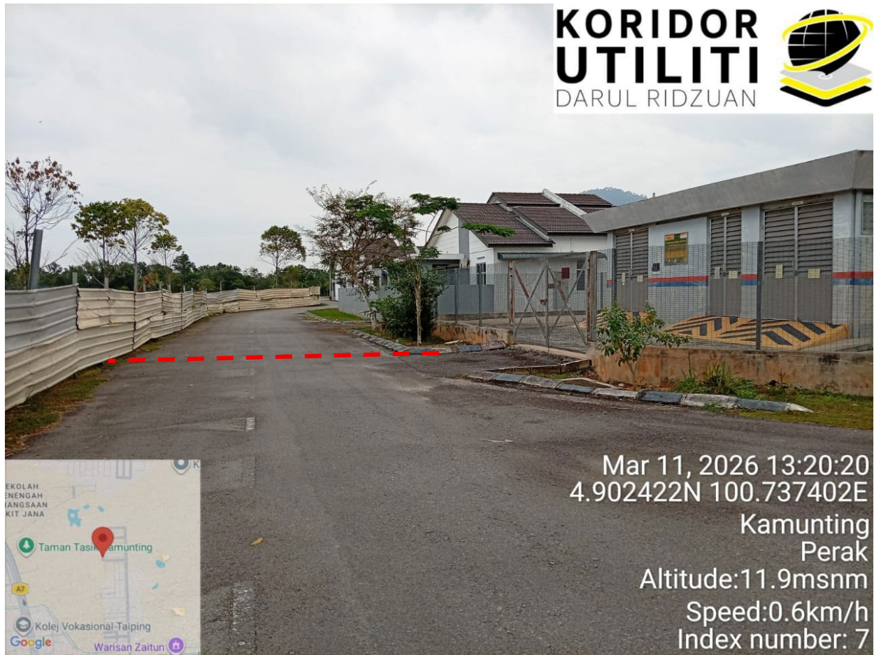
CADANGAN LALUAN OPEN CUT