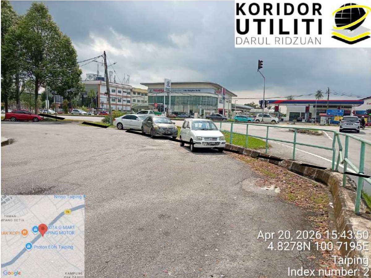
CADANGAN LALUAN HDD