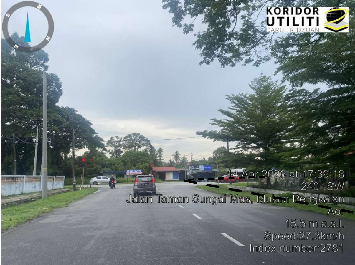
CADANGAN LALUAN HDD