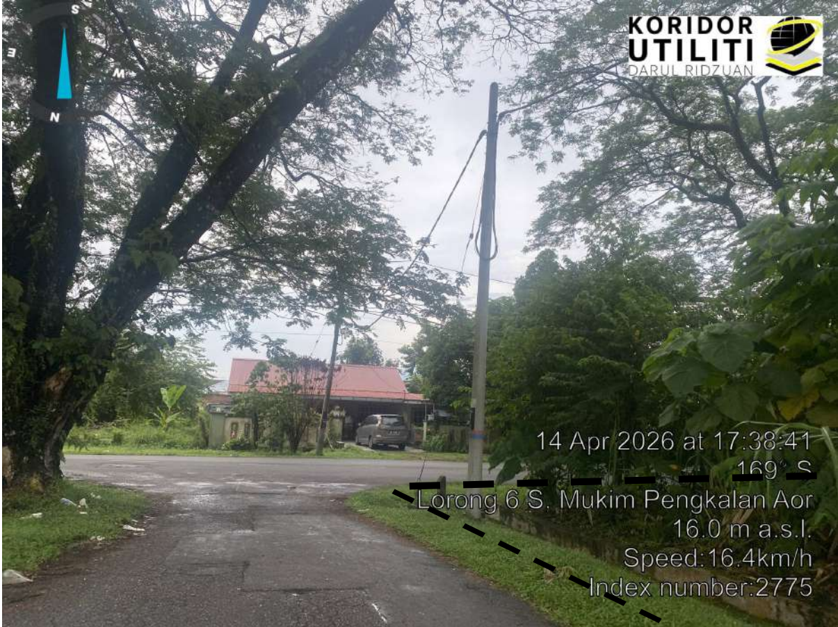
CADANGAN LALUAN HDD