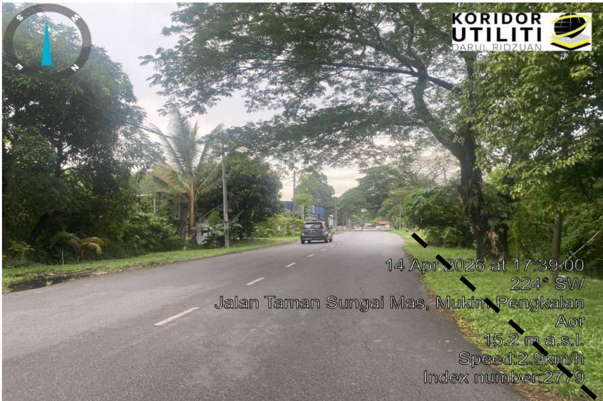
CADANGAN LALUAN HDD