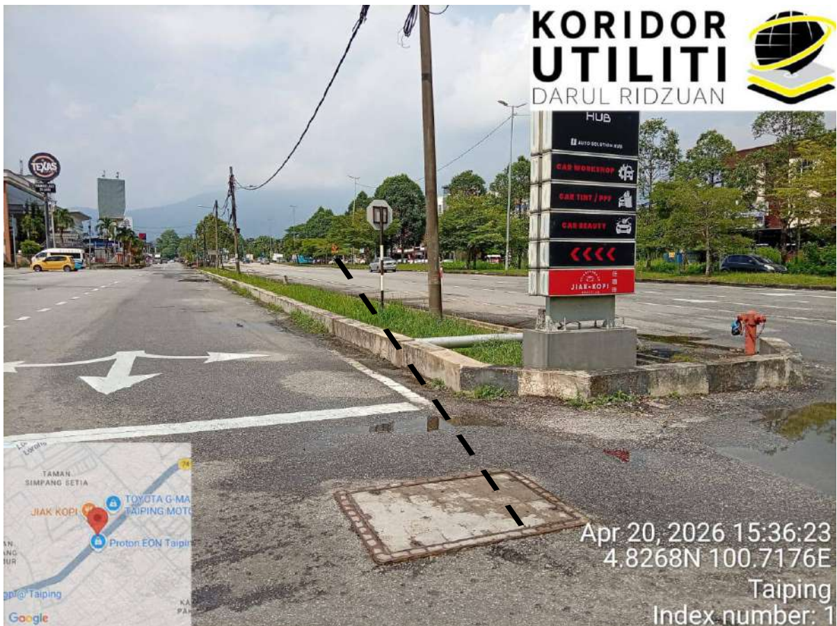
CADANGAN LALUAN HDD & KOORDINAT PADA EXISTING MANHOLE