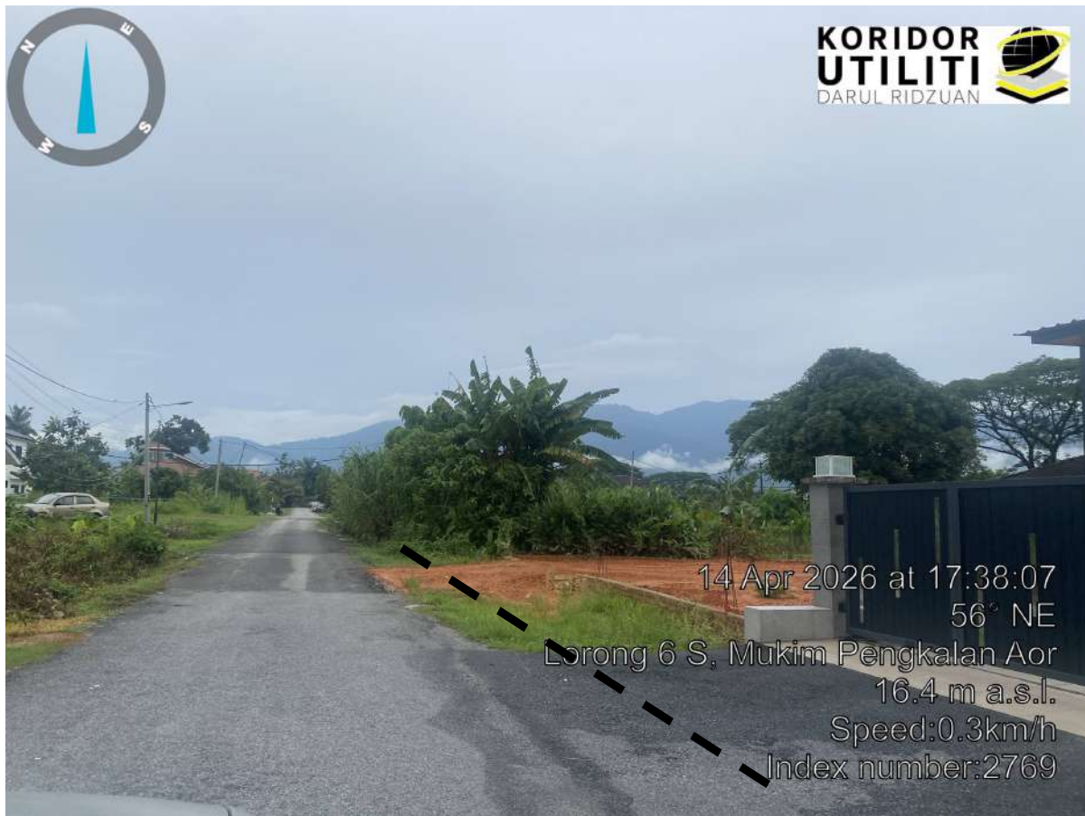
CADANGAN LALUAN HDD