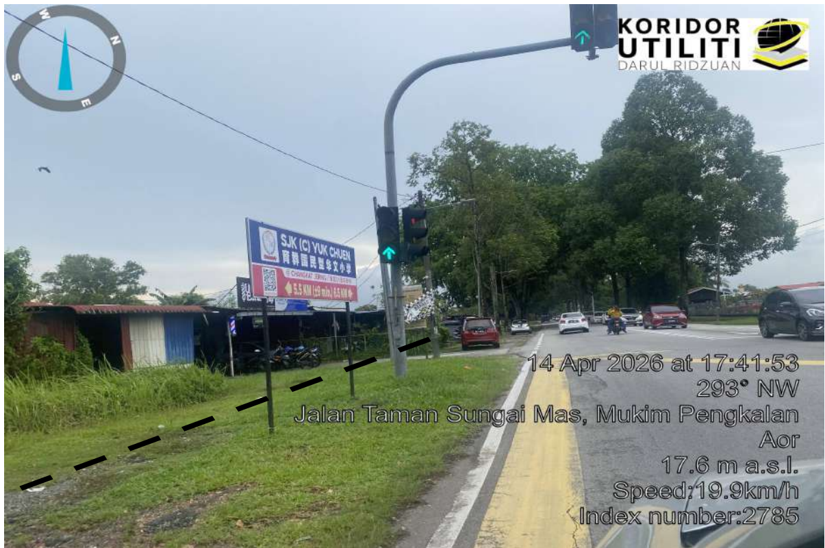
CADANGAN LALUAN HDD