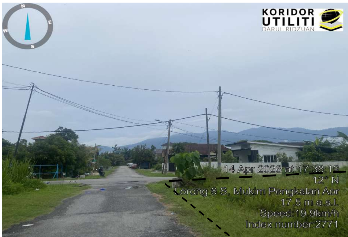
CADANGAN LALUAN HDD