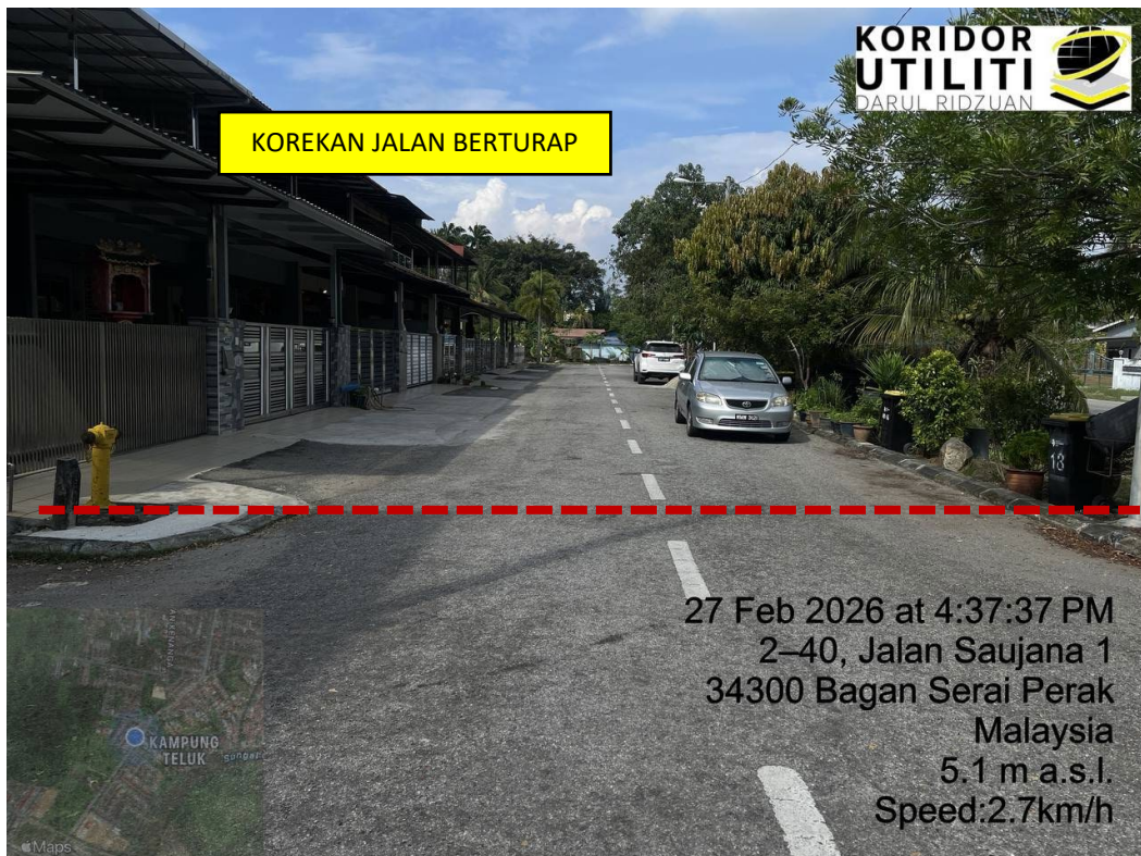
LOKASI DI JALAN SAUJANA 1