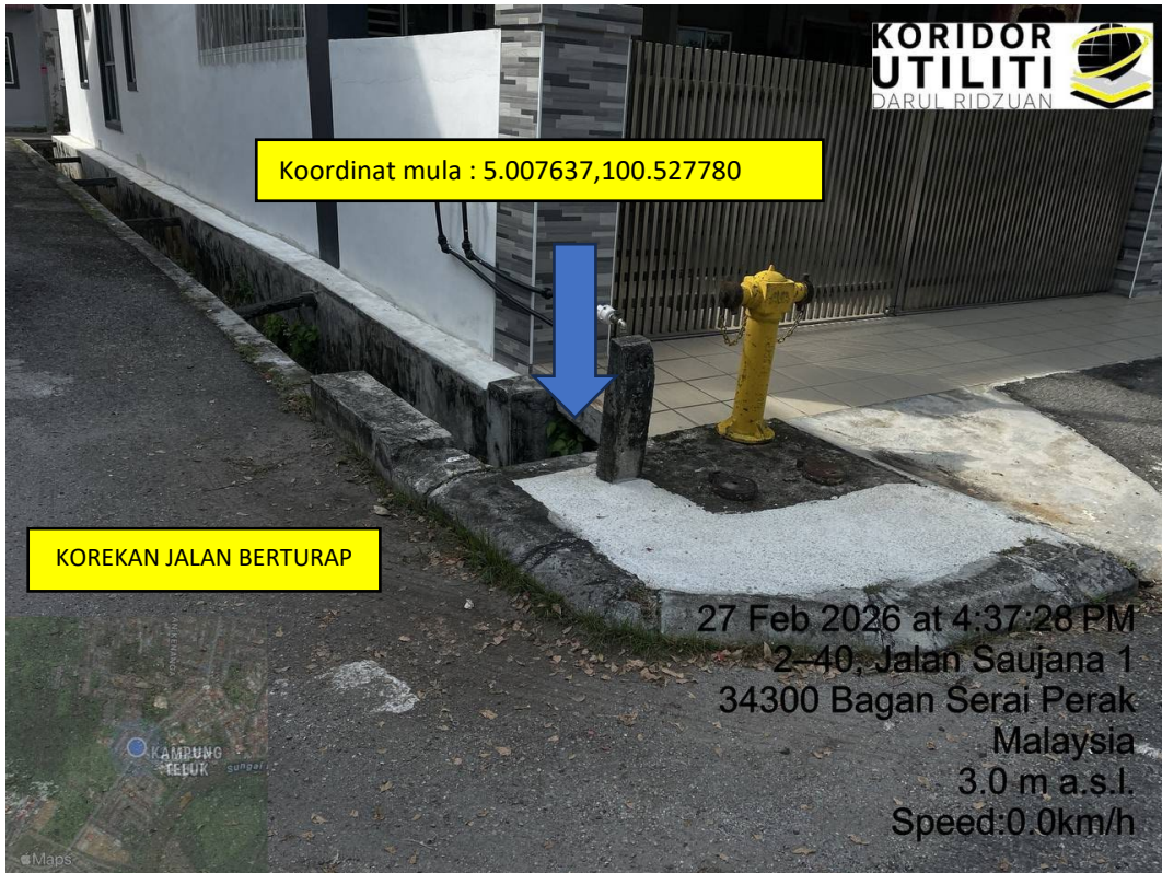
LOKASI DI JALAN SAUJANA 1