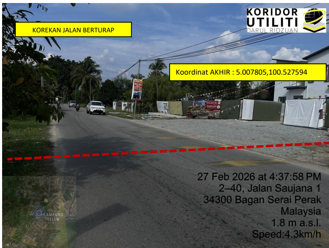
LOKASI DI JALAN MAHSURI