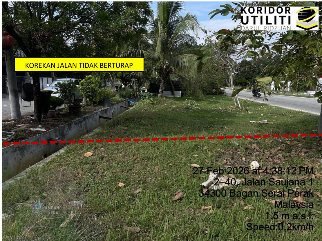
LOKASI DI JALAN MAHSURI