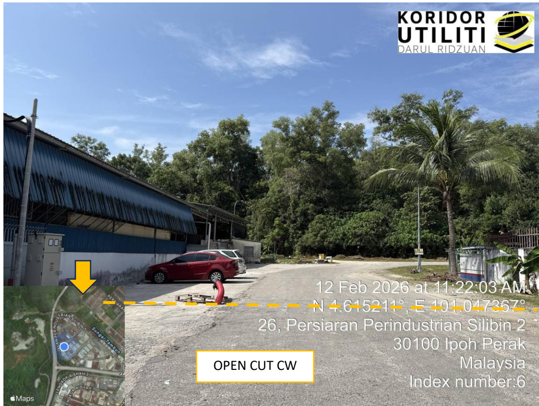
KOORDINAT MULA DI METER KIOSK TNB