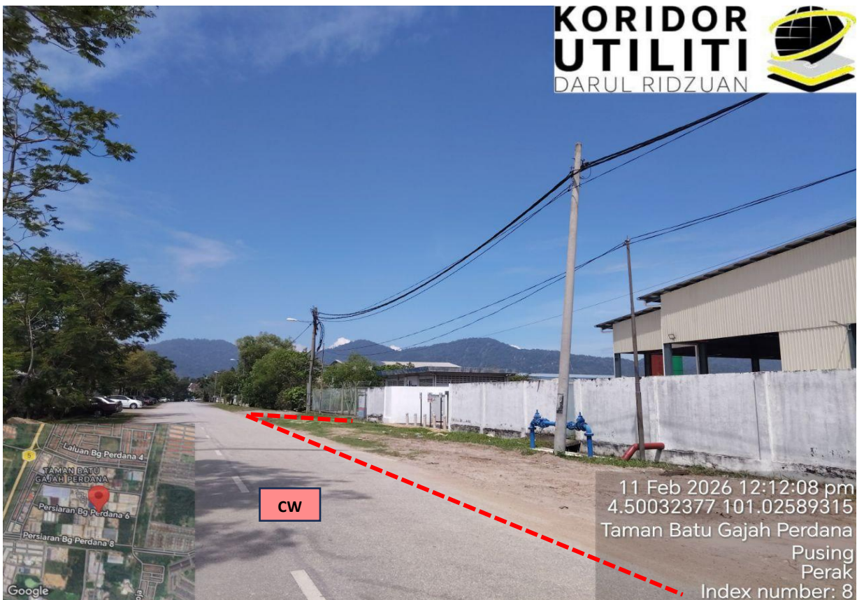
LOKASI KERJA-KERJA KOREKAN TERBUKA DI PERSIARAN BG PERDANA 6