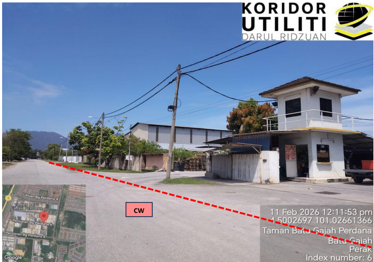
LOKASI KERJA-KERJA KOREKAN TERBUKA PERSIARAN BG PERDANA 6