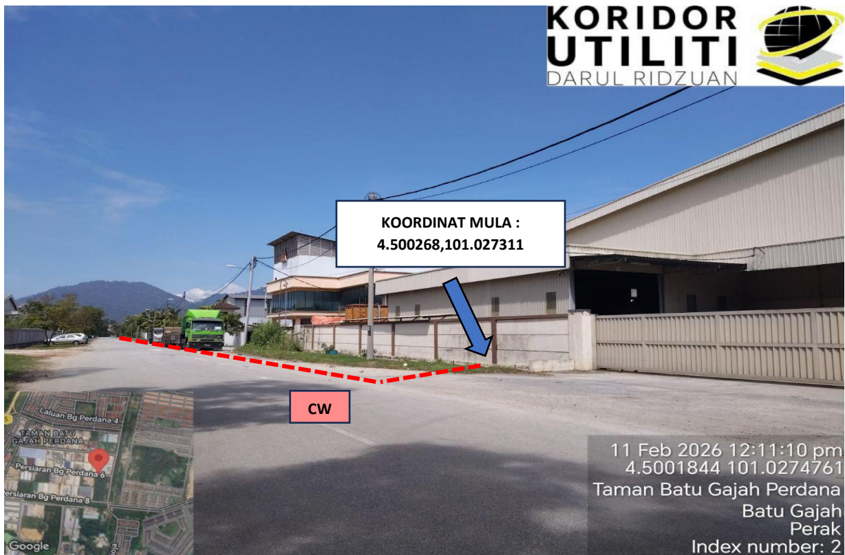
LOKASI KOORDINAT MULA KERJA-KERJA KOREKAN TERBUKA DI PERSIARAN BG PERDANA 6