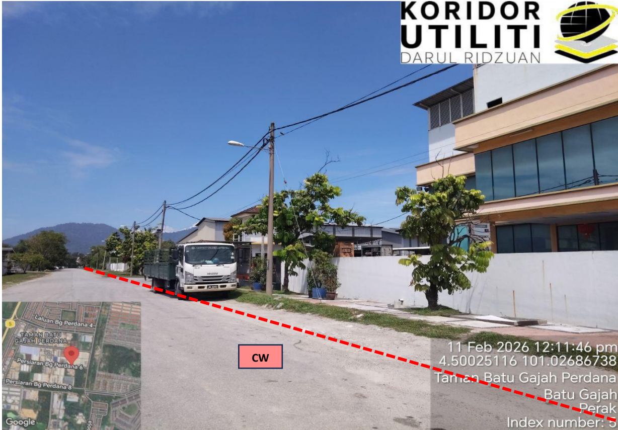
LOKASI KERJA-KERJA KOREKAN TERBUKA DI PERSIARAN BG PERDANA 6