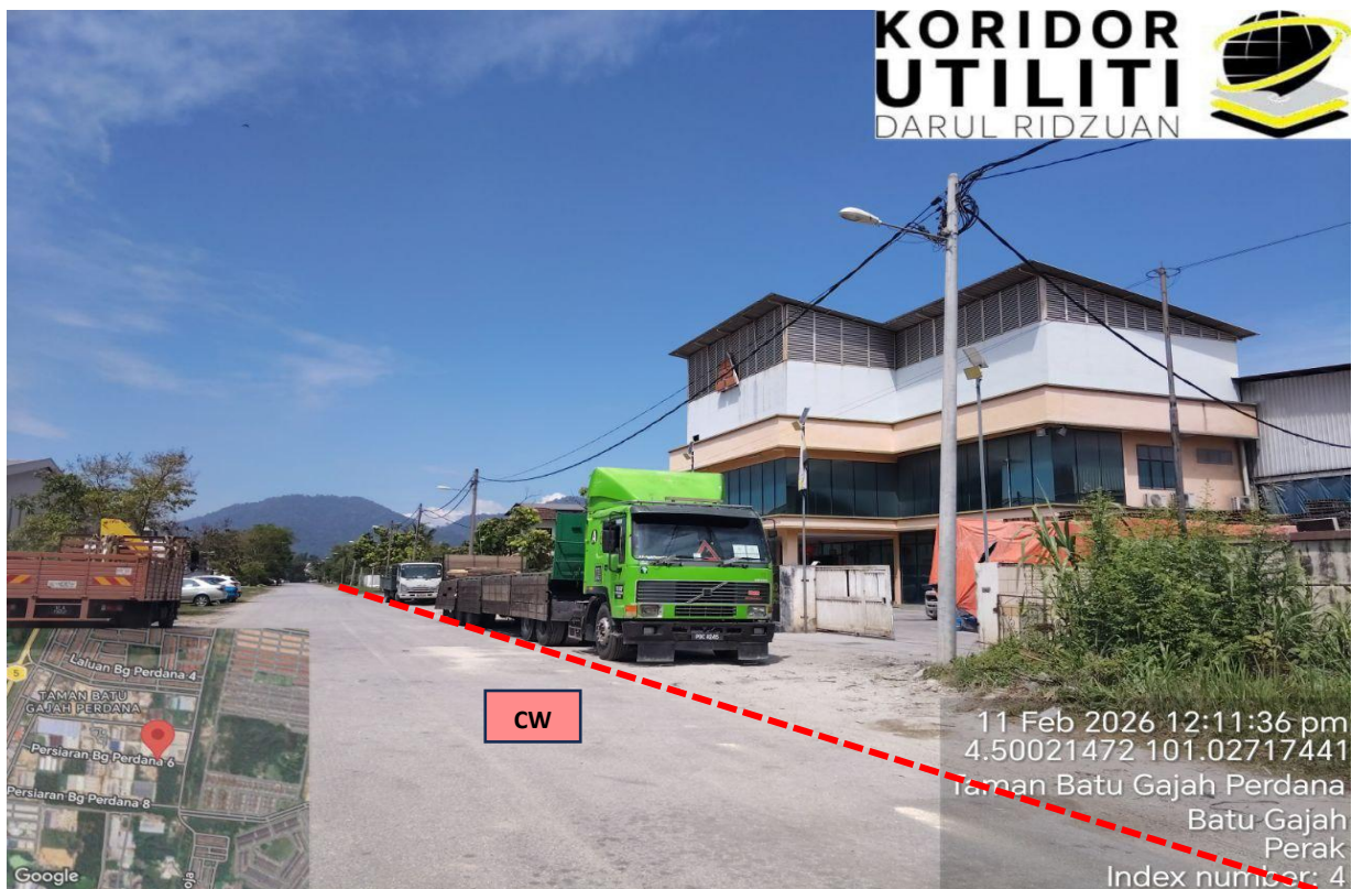
LOKASI KERJA-KERJA KOREKAN TERBUKA DI PERSIARAN BG PERDANA 6