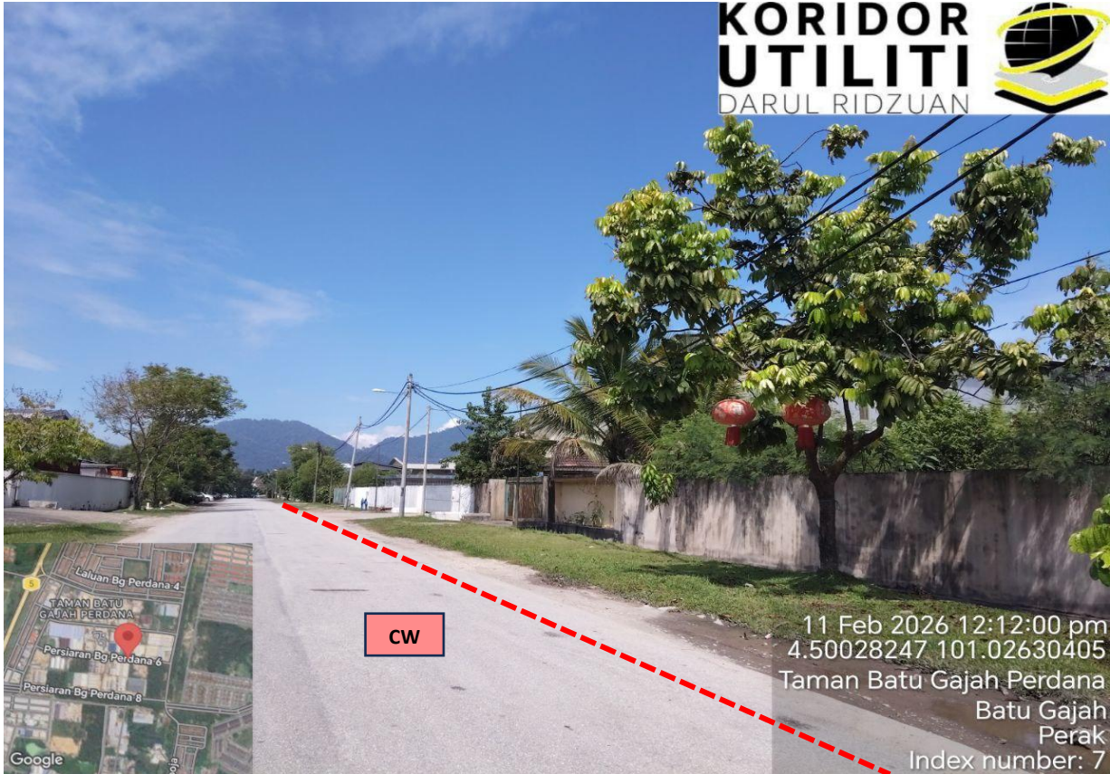
LOKASI KERJA-KERJA KOREKAN TERBUKA DI PERSIARAN BG PERDANA 6