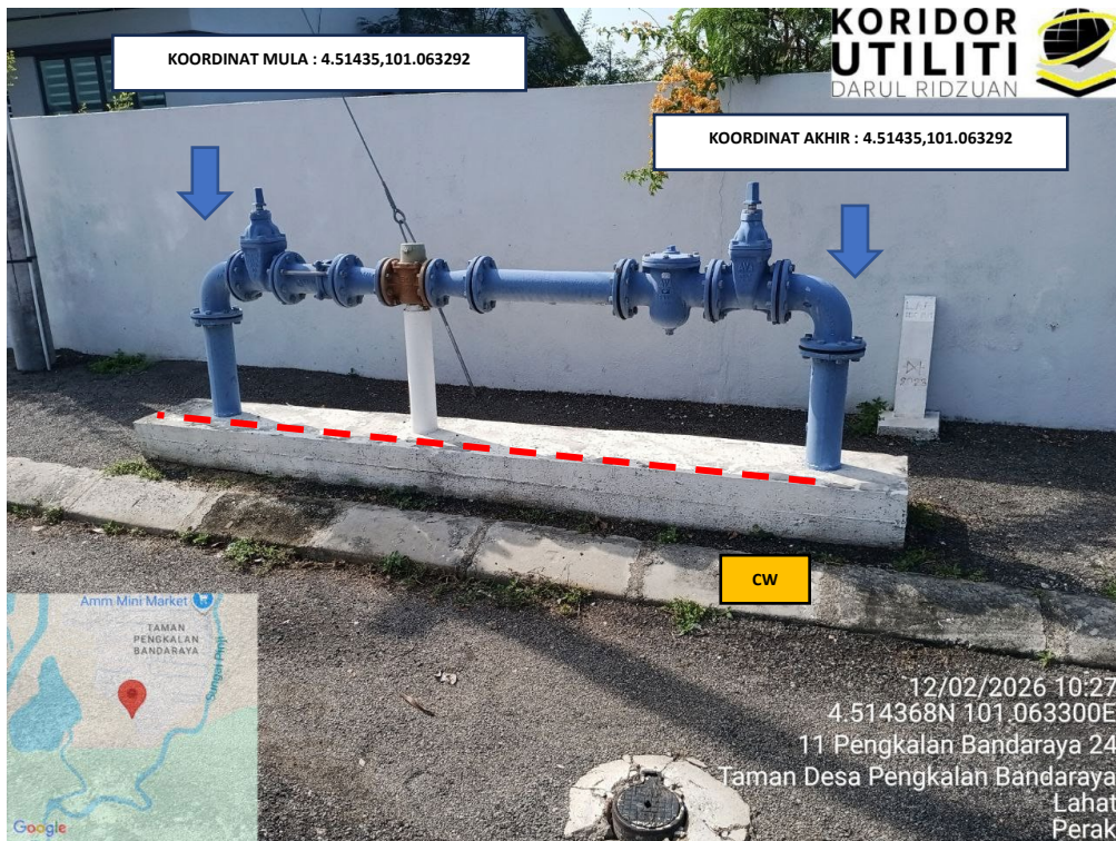
LOKASI KOORDINAT MULA DAN AKHIR KOREKAN TERBUKA DI JALAN PENGKALAN BANDARAYA 26