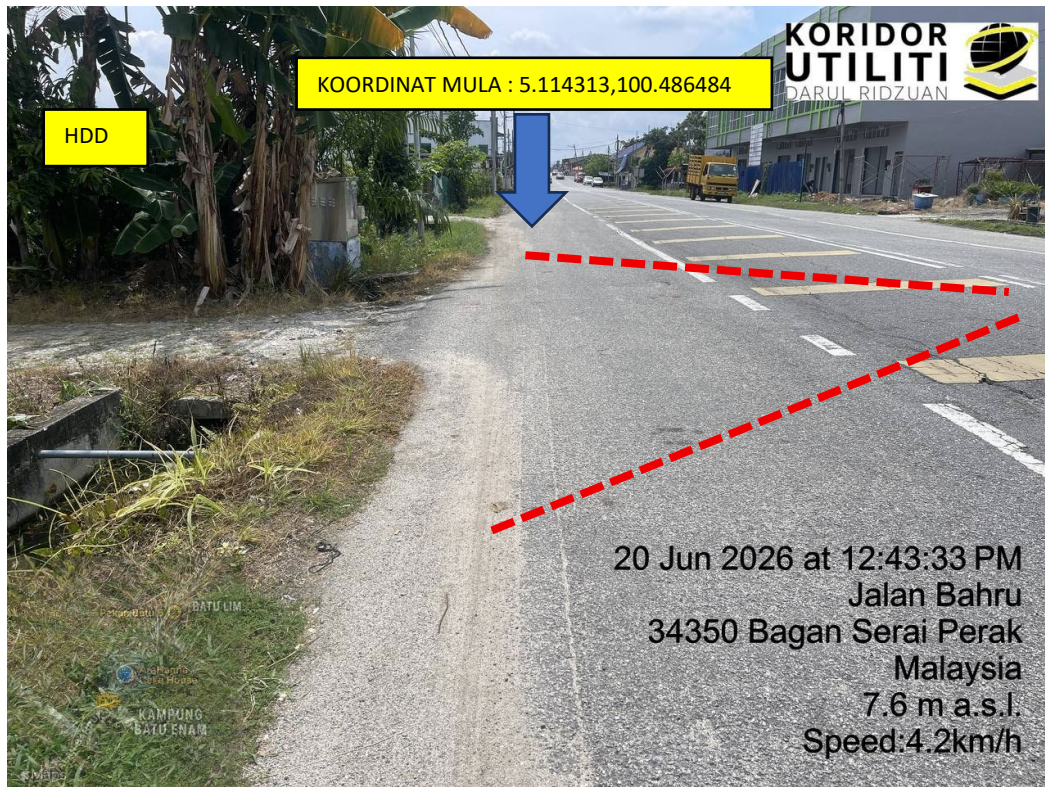
LOKASI DI JALAN BAHARU