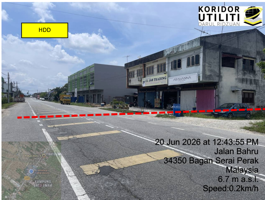
LOKASI DI JALAN BAHARU