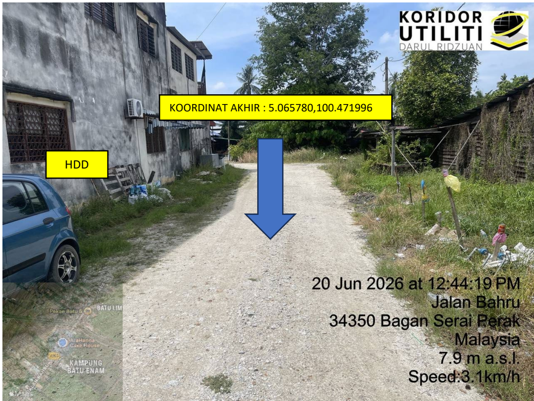
LOKASI DI JALAN BAHARU